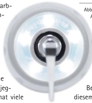
Abb. oben: Piezo Scaler Tigon+. – Abb. links: Handstück mit fünf- fachem LED-Ring.

Um die täglichen Arbeitsprozesse um ein Vielfaches zu vereinfachen, wurde Tigon+ mit vielen Raffinessen versehen. So zum Beispiel mit einem großen und