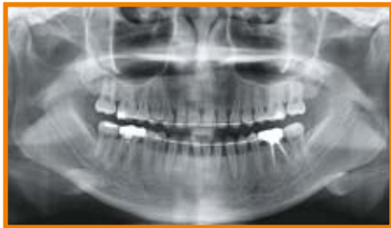
>> Top OPG Qualität - unlimited

Noch nie war der Einstieg in 3D Röntgen so attraktiv und flexibel!