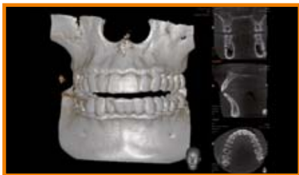
>> Flatrate mit unlimitierter Anzahl 3D Aufnahmen im 1. Jahr