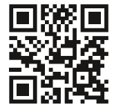
Mercy Ships Film

Auch Sie können nun 2013 vor Ort ehrenamtlich helfen. Sie investieren mindestens zwei Wochen Ihrer Zeit und Dürr Dental übernimmt die anfallenden Transfer- und Verpflegungskosten für freiwillige Zahnärzte, -ärztinnen und Assistentinnen.