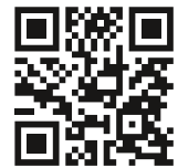
Mercy Ships Film

Auch Sie können nun 2013 vor Ort ehrenamtlich helfen. Sie investieren mindestens zwei Wochen Ihrer Zeit und Dürr Dental übernimmt die anfallenden Transfer- und Verpflegungskosten für freiwillige Zahnärzte, -ärztinnen und Assistentinnen.