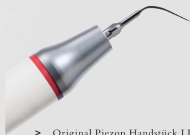
> Original Piezon Handstück LED mit EMS Swiss Instrument PS

Praktisch keine Schmerzen für den Patienten und maximale Schonung des oralen Epitheliums – grösster Patientenkomfort ist das überzeugende Plus der Original Methode Piezon, neuester Stand. Zudem punktet sie mit einzigartig glatten Zahnoberflächen. Alles zusammen ist das Ergebnis von linearen, parallel zum Zahn verlaufenden Schwingungen der Original EMS Swiss Instruments in harmonischer Abstimmung mit dem neuen Original Piezon Handstück LED.