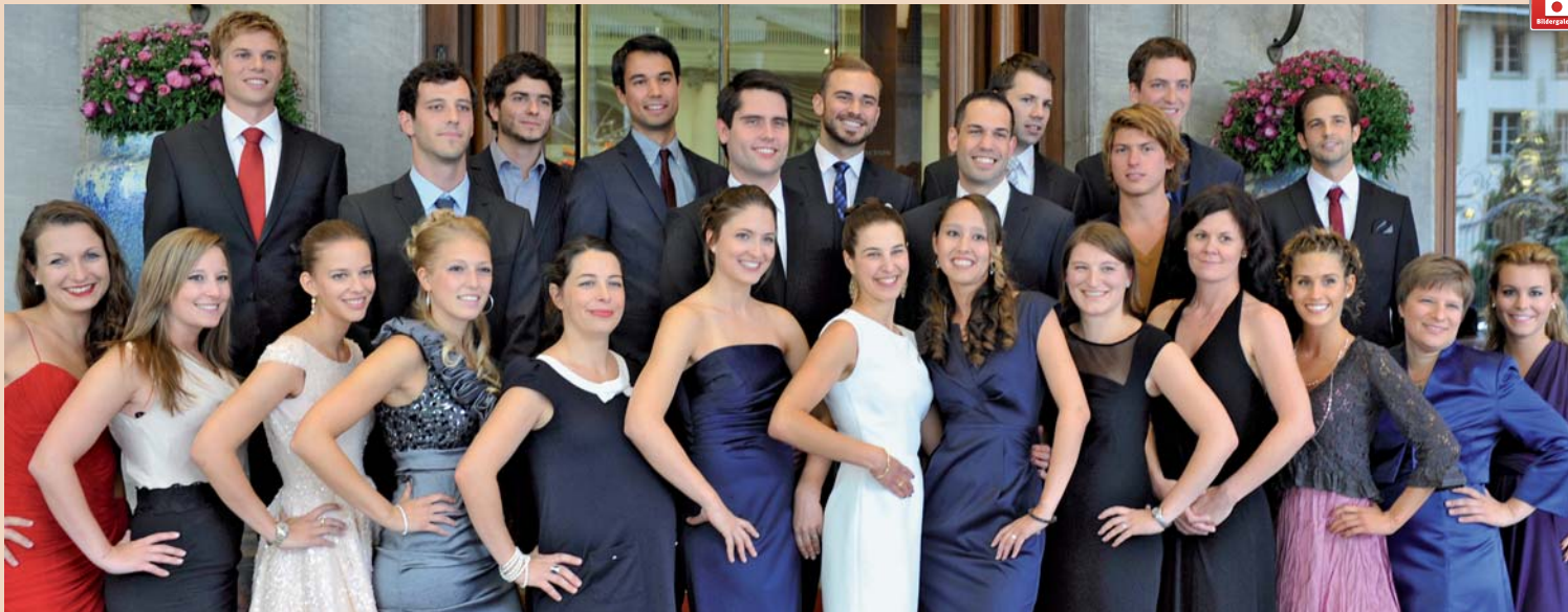
Alle 25 Kandidaten haben bestanden. 13 junge Zahnärztinnen und 11 Zahnärzte posieren auf der Treppe des Bellevue Place, Bern. (Ein Absolvent war nicht anwesend.)