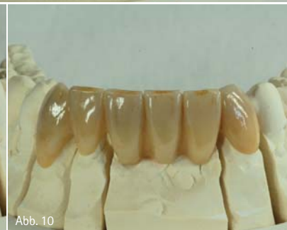
Abb. 8: Die Aufnahmen auf dem Sägemodell ... – Abb. 9: ... zeigen die verschiedenartige Wirkung der Farben ... – Abb. 10 ... bei unterschiedlichen Lichtverhältnissen.

Lava™-Farben werden nicht lediglich auf die Zirkoniumoxid-Oberfläche aufgetragen, sondern sie wirken mittels Ionen von innen heraus. Die enthaltenen Ionen lassen die Farbe in das Zirkoniumoxid hinein diffundieren, so dass sie beim Sintern ein integrierter Bestandteil des Zirkoniumoxids wird, statt lediglich eine farbige Schicht zu bilden, mit der die Keramik überzogen ist. Dies ist ein unschätzbare ästhetischer Vorteil gegenüber vorgefärbtem Zirkoniumoxid und vorgefärbter Glaskeramik.