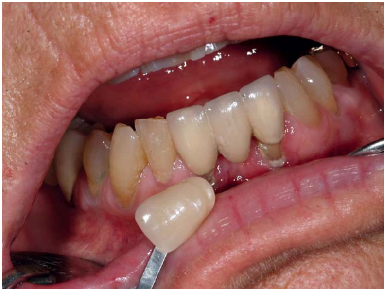
Abb. 1: Ausgangsbefund: Die vorhandene dreigliedrige UK-Frontzahnbrücke musste ersetzt werden.

Amerikanische Labore nutzen überwiegend vollmonolithische Keramikrestaurationen. Diese gelten als besonders rationell und eignen sich sogar für Patienten mit geringem interokklusalem Platzangebot. Zahntechnikermeister Rupprecht Semrau stellt in seinem Beitrag die Möglichkeiten mit Lava™ Plus vor.