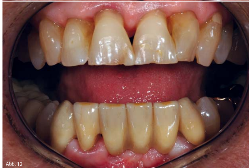
Abb. 11: Form und Farbe entsprechen der Situation im Mund. – Abb. 12: Im Zusammenspiel mit den farbigen Charakterisierungen integriert sich die Restauration unauffällig in den Restzahnbestand.

Anders als hierzulande propagiert man in den USA nicht ausschließlich zweifelhafte Gewinnversprechen mittels CAD/CAM oder konzentriert sich ausschließlich auf aufwendige High-End-Versorgungen (und lässt die weniger kostspieligen Versorgungslösungen lieber die Kollegen in China fertigen ...). Stattdessen nutzen die US-Labore aktiv ihre Chancen. Diese sehen so aus, dass sie vollmonolithische Restaurationen so bemalen, dass sie Reflexionen vortäuschen, wo keine sind. Dies sieht aber auch so aus, dass sie zahnfarbene vollmonolithische Versorgungsbukkal verblenden, wenn eine individuelle Schichtung gewünscht ist. In jedem Fall arbeiten sie rationeller und somit kostengünstiger als viele Labore hier in Deutschland, weil sich die Amerikaner nicht scheuen, Teile ihrer Produktion an spezialisierte Betriebe ausgliedern und dadurch selbst kleinste Betriebe Zugriff auf modernste Verfahren und Technologien haben.