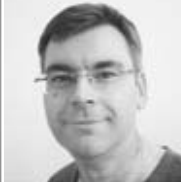
MKG Dr. Dr. B. L. München