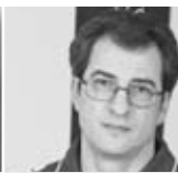
ZA M. C. Wiesbaden