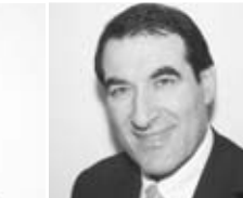
MKG Dr. Dr. A. S. Hannover