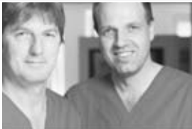
Oral-Ch. Dr. V. H. u. Oral-Ch. Dr. T. G. Leipzig