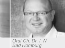
Oral-Ch. Dr. I. N. Bad Homburg