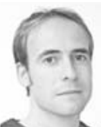
Oral-Ch. Dr. F. B. Stuttgart