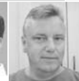
MKG C. R. Freising