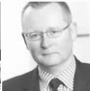
PAR Dr. C. K. Coesfeld