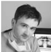
Oral-Ch. D. S. Chemnitz