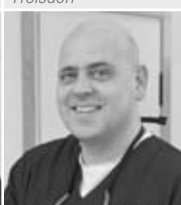
ZA S. H. München