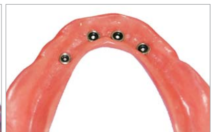
Abb. 3: Abformung, in der die Position der Implantate sichtbar ist. – Abb. 4: Prothesenbasis mit eingearbeiteten Matrizen.