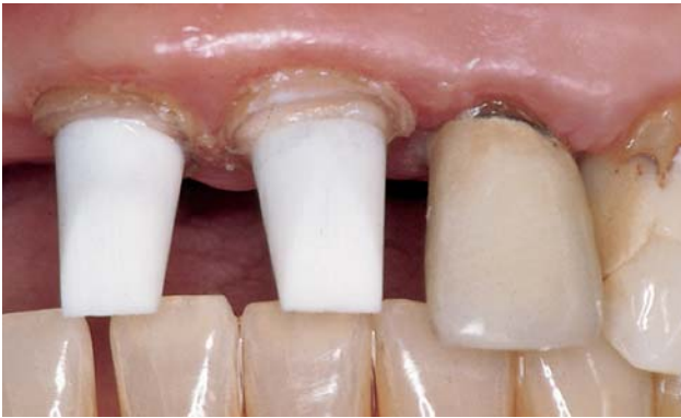
Abb. 4: Mit den CERACAP Glaskeramikappen bedient Komet die steigende Nachfrage nach hochästhetischen Lösungen.

des Systems, die vor allem durch das Vermeiden von Dentintraumata und das präzise Platzieren der Pins erreicht wurde. 1988 kam es zu einer wichtigen Modifikation dieser Pins: Sie wurden von Komet PCR-beschichtet nach einer Idee von Dr. S. Neumeyer, Eschlkam. Die biokompatiblen Pins aus Titan ermöglichten erstmals eine physikalisch-chemische Retention, sodass der Zahnarzt das Komposit adhäsiv und spaltfrei an den Stiften befestigen konnte. Die Silikat-Silan-Polymerschicht des koronalen Stiftteils verbindet sich dauerhaft mit dem Kompositmaterial, und klinische Untersuchungen bewiesen eine signifikant überlegene Haftkraft der silanisierten PCR-Stifte im Vergleich zu herkömmlichen Produkten. 8,9 Prof. I. Nergiz, Universität Hamburg, erinnert sich an die damaligen Studien 10,11 an derselben Poliklinik, an der er tätig ist, die aber damals Abteilung für Zahnerhaltungskunde und Parodontologie hieß: „Wir konnten feststellen, dass die Silanisierung von Wurzelstiften aus Titan die Haftung des plastischen Komposit-Aufbaumaterials um durchschnittlich 50 Prozent verbesserte. Durch das Auftragen von Polymerschicht auf die silanisierten Stifte konnte die Haftung nochmals um 15 Prozent gesteigert werden. Der Aufbau wurde in Sechskantform angefertigt und durch Torsion bis zum Bruch belastet, sodass seine Haftung ausschließlich durch den Materialverbund und nicht mechanisch begründet sein konnte. Neben der Retentionssteigerung versprach dieser innigere Kompo-