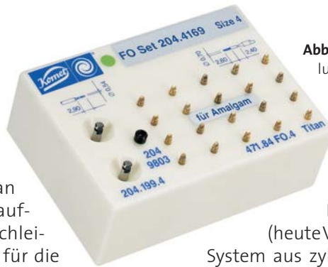
Abb. 3: Das FO-Set ist die logische Weiterentwicklung des MPS. Die Systeme bestehen aus einem Bohrer, einem Einschraubadapter und dem parapulpären Pin.