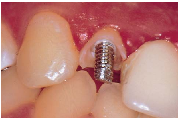
Abb. 10: Die BKS-Titanschrauben sind so aufeinander abgestimmt, dass keine zu großen Spannungen im Wurzeldentin auftreten.