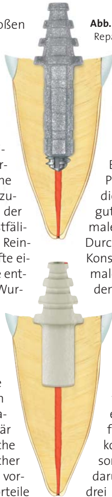
Abb. 12: Bei einem frakturierten Stiftaufbau wird dank des RepairPost-Systems einfach ein röhrenförmiger Wurzelstift über das Fragment gesetzt. – Abb. 13: Beim RepairPost Fibre-System sind die Hohlstifte nicht aus Titan, sondern aus glasfaserverstärktem Komposit gefertigt.