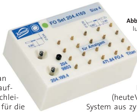
Abb. 3: Das FO-Set ist die logische Weiterentwicklung des MPS. Die Systeme bestehen aus einem Bohrer, einem Einschraubadapter und dem parapulpären Pin.