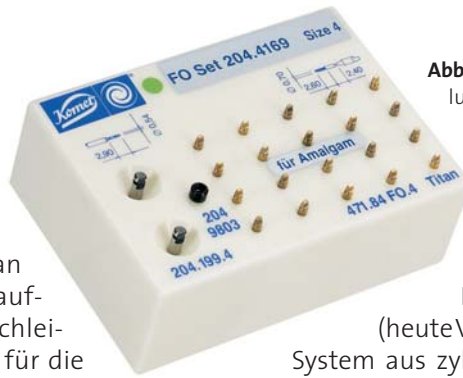
Abb. 3: Das FO-Set ist die logische Weiterentwicklung des MPS. Die Systeme bestehen aus einem Bohrer, einem Einschraubadapter und dem parapulären Pin.