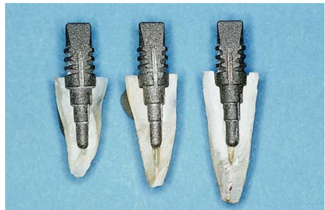
Abb. 11: Komets entwickelt für jede Indikation eine Stiftform, die der anatomischen Gegebenheit koronal wie radikulär exakt entspricht.