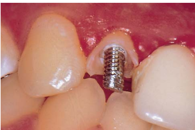
Abb. 10: Die BKS-Titanschrauben sind so aufeinander abgestimmt, dass keine zu großen Spannungen im Wurzelkambium auftreten.

Dr. Bernhard Braun, niedergelassener Zahnarzt in Edenkoben, inspirierte Komet 1989 hinsichtlich des Designs von Wurzelschrauben. Man wusste damals sehr wohl von den möglichen Nachteilen der zylindrischen Form und der Gefahr von Wurzelfrakturen durch Spannungsrisse, aber man schätzte auch die große Retention von Wurzelschrauben im Wurzelkanal, auch wenn aufgrund ungünstiger Wurzelanatomie der Wurzelstift nicht die ideale Länge erreicht. Mit dem BKS-System, einem rationellen Wurzelschraubensystem aus Titan, schaffte es Komet, dass Schrauben in jeder Länge verwendbar sind, da kein Retentionskopf am koronalen Ende vorhanden ist (Abb. 10). Die Instrumente sind so