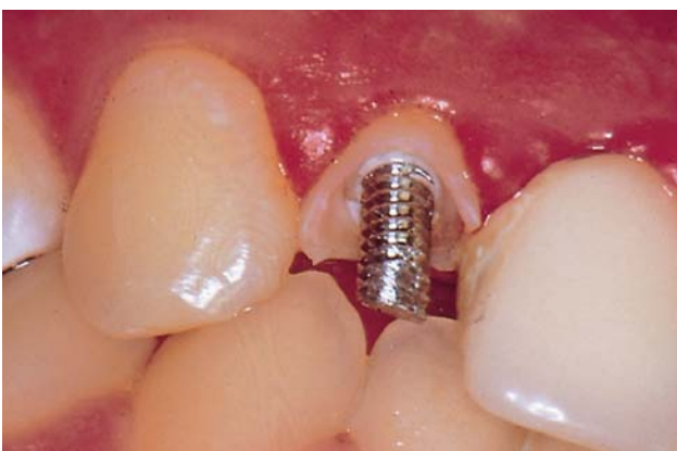
Abb. 10: Die BKS-Titanschrauben sind so aufeinander abgestimmt, dass keine zu großen Spannungen im Wurzeldentin auftreten.