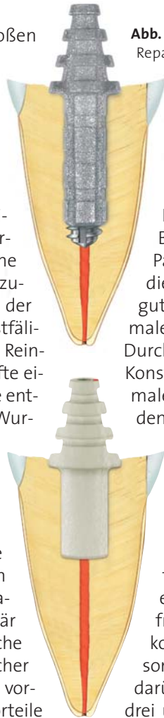
Abb. 12: Bei einem frakturierten Stiftaufbau wird dank des RepairPost-Systems einfach ein röhrenförmiger Wurzelstift über das Fragment gesetzt. – Abb. 13: Beim RepairPost Fibre-System sind die Hohlstifte nicht aus Titan, sondern aus glasfaserverstärktem Komposit gefertigt.