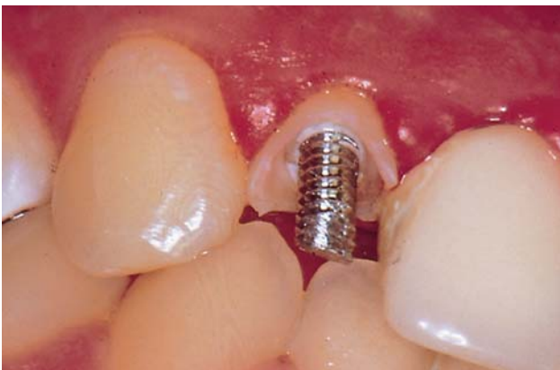
Abb. 10: Die BKS-Titanschrauben sind so aufeinander abgestimmt, dass keine zu großen Spannungen im Wurzeldentin auftreten.