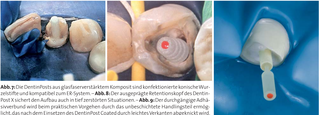
Abb. 7: Die DentinPosts aus glasfaserverstärktem Komposit sind konfektionierte konische Wurzelstifte und kompatibel zum ER-System. – Abb. 8: Der ausgeprägte Retentionskopf des Dentin-Post X sichert den Aufbau auch in tief zerstörten Situationen. – Abb. 9: Der durchgängige Adhäsivverbund wird beim praktischen Vorgehen durch das unbeschichtete Handlingsteil ermöglicht, das nach dem Einsetzen des DentinPost Coated durch leichtes Verkanten abgeknickt wird.

tätsmodul besitzen und bei der adhäsiven Applikation eine stressfreie Übertragung der auftretenden Kräfte in die Zahnwurzel zulassen. Der DentinPost X mit ausgeprägtem Retentionskopf wurde sehr schnell zur beliebten Alternative, wenn ein Aufbau auch in tiefer zerstörten Situationen funktionieren sollte (Abb. 8). Dass die Oberflächenbeschaffenheit der Stifte eine enorme Rolle spielt, hatte man bei Komet bereits mit dem Erfolg der PCR-Stifte erlebt und so sollte auch der DentinPost durch Beschichtung aufgewertet werden. Der DentinPost Coated ist vollständig silikatisiert, silaniert und mit einer Polymerschicht versehen, um apikal bis koronal identische Grenzflächen zwischen Stift und Komposit zu gewährleisten. Dieser durchgängige Adhäsivverbund wird beim DentinPost Coated beim praktischen Vorgehen durch ein unbeschichtetes Handlingsteil ermöglicht, das nach dem Einsetzen durch leichtes Verkanten abgeknickt wird (Abb. 9). Sotiria Markopoulou, Komet Validierungsmanagement, widmete sich anlässlich ihrer Diplomarbeit an der Ingenieur-Fachhochschule Osnabrück der Untersuchung der adhäsiven Verbundfestigkeit verschiedener Befestigungskomposite zu glasfaserverstärkten Wurzelstiften in Abhängigkeit der Stiftoberflächenkonditionierung. Markopoulou: „Allgemein ermittelte Durchschnittswerte maximaler Belastbarkeit, wie sie in der Literatur (Schwickerath, 1992) immer wieder zu finden sind, liegen bei Seitenzähnen und bei Frontzähnen zwi-