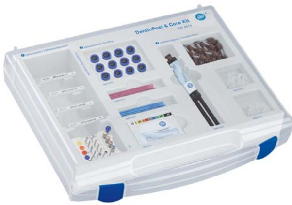
Abb. 14: Das DentinPost & Core Kit enthält alles in einem Koffer, was für die postendodontische Versorgung benötigt wird.

schönes Beispiel dafür ist aktuell das DentinPost & Core Kit. Dahinter steht ein Koffer, der alles enthält, was der Zahnarzt für die postendodontische Versorgung benötigt: Angefangen vom Wurzelstift DentinPost Coated samt passendem Instrumentarium für die Stiftbettpräparation über das selbststützende Bonding DentinBond Evo bis hin zum Stiftbefestigungs- und Stumpfaufbaukomposit DentinBuild Evo inklusive hilfreicher Formkappen für den Stumpfaufbau (Abb. 14). Einmal aufgeklappt, kann mit System vorgegangen werden. 20