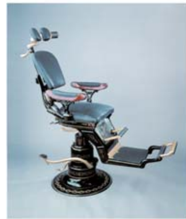
Ritter Behandlungsstuhl von 1887