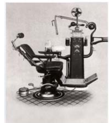
Ritter Behandlungs-System von 1917 - die Geburtsstunde der modernen Behandlungseinheit