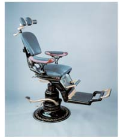
Ritter Behandlungsstuhl von 1887