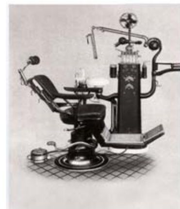
Ritter Behandlungs-System von 1917 - die Geburtsstunde der modernen Behandlungseinheit