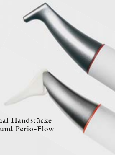
> Original Handstücke Air-Flow und Perio-Flow

Und wenn es um das klassische supragingivale Air-Polishing geht,