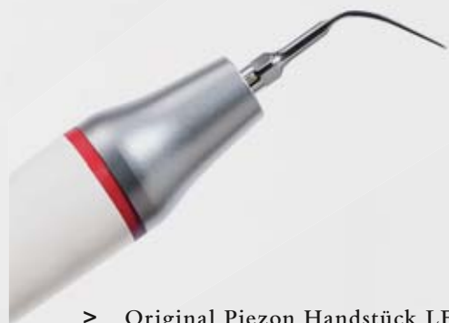
> Original Piezon Handstück LED mit EMS Swiss Instrument PS

Praktisch keine Schmerzen für den Patienten und maximale Schonung des oralen Epitheliums – grösster Patientenkomfort ist das überzeugende Plus der Original Methode Piezon, neuester Stand. Zudem punktet sie mit einzigartig glatten Zahnoberflächen. Alles zusammen ist das Ergebnis von linearen, parallel zum Zahn verlaufenden Schwingungen der Original EMS Swiss Instruments in harmonischer Abstimmung mit dem neuen Original Piezon Handstück LED.