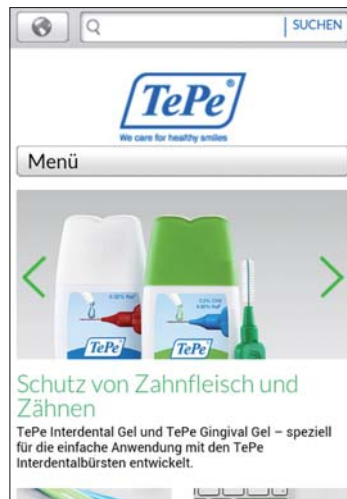
Abbildung auf einem Smartphone.

Der schwedische Spezialist für Mundhygieneprodukte bietet unter www.tepe.com eine umfangreichere Plattform für alle Besucher an. Hier finden nun auch Endverbraucher auf der Startseite Tipps und Hinweise zur gründlichen Zahnpflege und