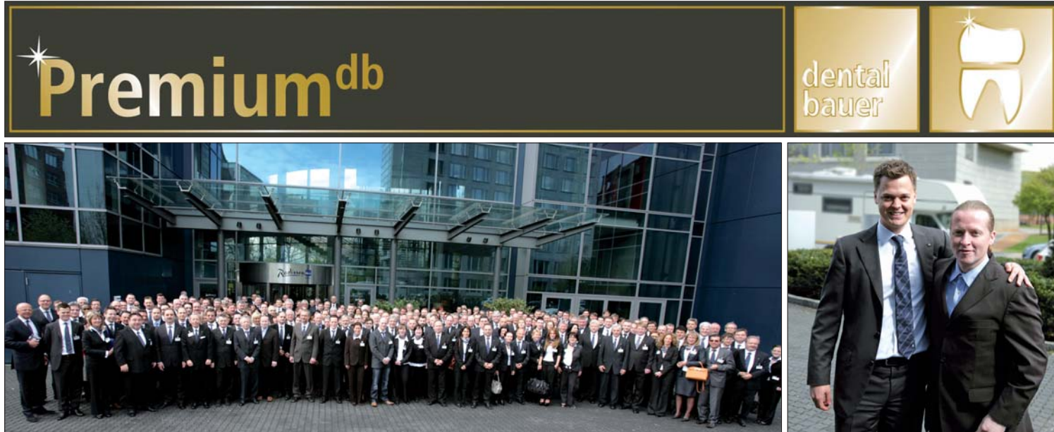
Die Teilnehmer kamen aus allen dental bauer Standorten und Unternehmensbereichen.