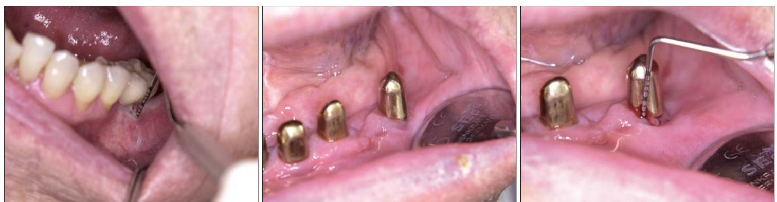
Abb. 4: Blutung und Pusaustritt nach Sondierung, fehlende befestigte Gingiva und Fistelbildung. – Abb. 5: Implantatgetragenes Teleskop ohne spontane Entzündungszeichen oder Symptomatik. – Abb. 6: Deutliche erhöhte Sondierungstiefen mit resultierender Blutung.

Die Mukositis als Vorstufe einer Periimplantitis kann durch geeignete Prophylaxemaßnahmen vermieden werden. Somit könnte die schwierige und nicht vorher-sagbare Behandlung einer Periimplantitis entfallen. Derzeit existiert noch keine überlegene Therapieform bezüglich einer manifesten Periimplantitis. Welche zusätzliche Therapie zum konventionellen mechanischen Débridement (mit Antiseptika und eventuell Antibiotika) genutzt wird, bleibt dem einzelnen Behandler selbst überlassen. Zur endgültigen Entscheidung müssen weitere Studien abgewartet werden. PN