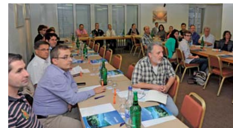
40 Zahnärzte und Zahntechniker kamen zur SZAZ Fortbildung „Computergestützte Technologie für Zahnärzte und Zahntechniker“ nach Abtwil/SG.

systemunabhängig, es sind keine Investitionen erforderlich, ebenso entfällt die Lagerhaltung.