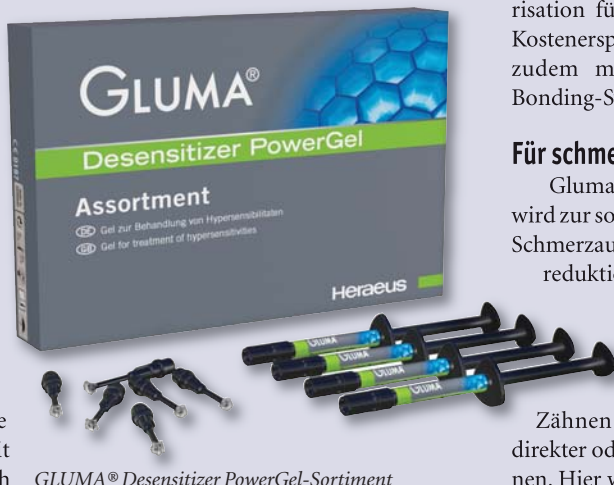
GLUMA® Desensitizer PowerGel-Sortiment

Gluma® Desensitizer PowerGel zur Vermeidung von Dentinhypersensibilitäten ist seit Beginn des Jahres auch in Europa erhältlich. Es überzeugt wie Gluma® Desensitizer durch effektive Wirksamkeit und sofortige Schmerzreduktion. Die gelartige Konsistenz und seine grüne Farbe ermöglichen eine punktgenaue und kontrollierte Applikation und damit vereinfachtes Auftragen. Das schafft eine höhere Präzision und minimiert das potenzielle Risiko des Kontaktes mit dem Weichgewebe. Durch