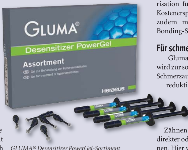
GLUMA® Desensitizer PowerGel-Sortiment

Gluma® Desensitizer PowerGel zur Vermeidung von Dentinhypersensibilitäten ist seit Beginn des Jahres auch in Europa erhältlich. Es überzeugt wie Gluma® Desensitizer durch effektive Wirksamkeit und sofortige Schmerzreduktion. Die gelartige Konsistenz und seine grüne Farbe ermöglichen eine punktgenaue und kontrollierte Applikation und damit vereinfachtes Auftragen. Das schafft eine höhere Präzision und minimiert das potenzielle Risiko des Kontaktes mit dem Weichgewebe. Durch