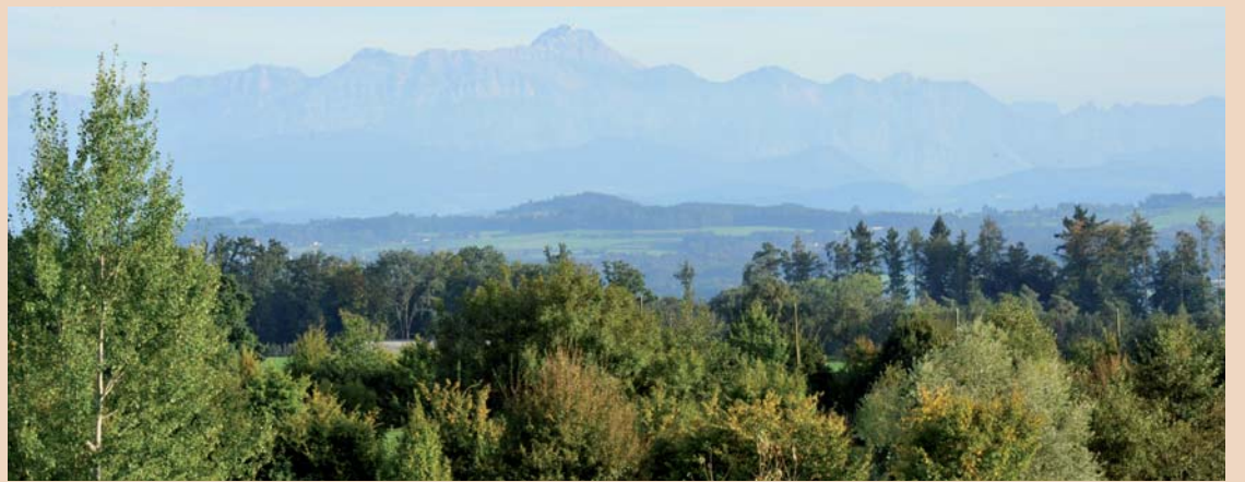
Blick vom Kurslokal im Golf-Club Lipperswil zum Säntismassiv.

Die Referenten, Universitätsprofessoren und Privatdozenten sowie erfahrene Praktiker, die auch als Instruktoren an Universitäten arbeiten, gewährleisten eine hervorragende theoretische und praktische Weiterbildung. Zum Erfolg der Intensivwoche trägt auch die Umgebung bei. Das Golfpanorama-Hotel mit Aussicht über die Obstwiesen auf