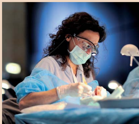
Eigene Fähigkeiten trainieren an einem der praktischen Workshops am Osteology Symposium in Monaco.