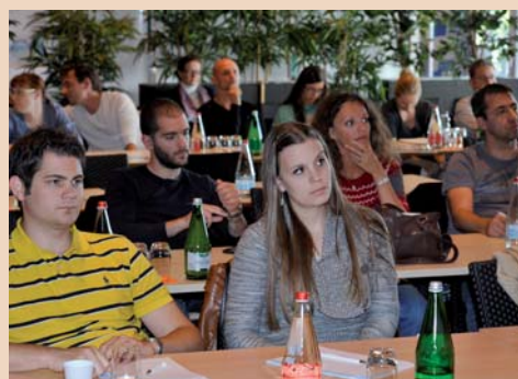
Assistenten und Praxiszahnärzte profitierten gleichermaßen vom konzentrierten Lehrstoff.