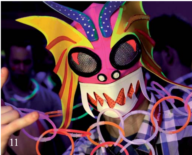
BuFaTa Münster – Impressionen.