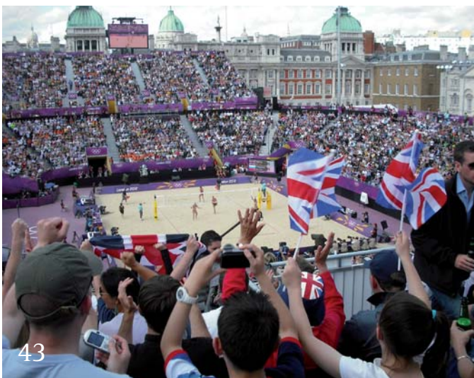
Olympia in London – Reisenotizen.