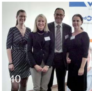
Nachbericht VOCO Dental Challenge.