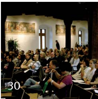
Nachbericht ITI Meeting.