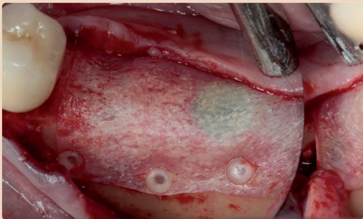
Fall von Dr. Kai Zwanzig, Bielefeld.

branpin seine mechanische Festigkeit und es beginnen Masseabbau und Resorption des Stiftes. Dieser erfolgt durch Hydrolyse zu Milchsäure, die anschließend zu CO 2 und H 2 O metabolisiert wird. Nach neun Monaten ist das Implantat resorbiert. PT