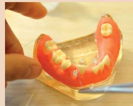
Übungen am Modell mit der Geistlich Bio-Gide® Membran.