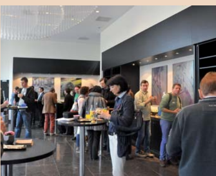
Apéro im neuen Renaissance Zurich Tower Hotel an der Hardtbrücke. Das Ambiente in den Veranstaltungsräumen und Foyer ist sehr angenehm.