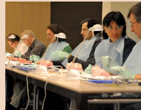
Praktische Übungen mit vielen Tipps seitens der Referenten erlaubten den Teilnehmern eine klare Indikationsabgrenzung.