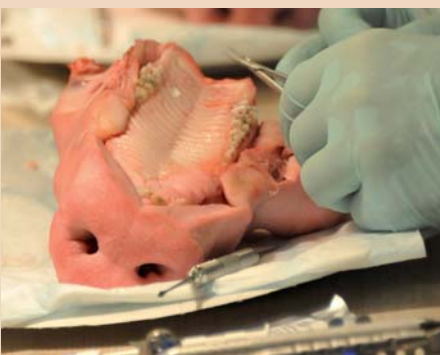
Applizieren einer Geistlich Mucograft® Kollagenmatrix am Schweinekiefer.