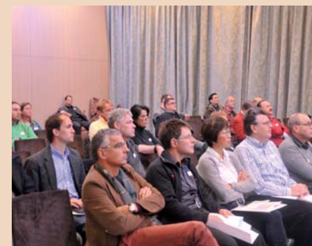
Aufmerksame Zuhörer beim theoretischen Teil des Workshop-Days in Zürich.