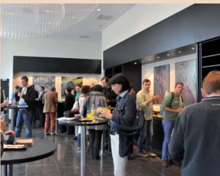
Apéro im neuen Renaissance Zurich Tower Hotel an der Hardtbrücke. Das Ambiente in den Veranstaltungsräumen und Foyer ist sehr angenehm.