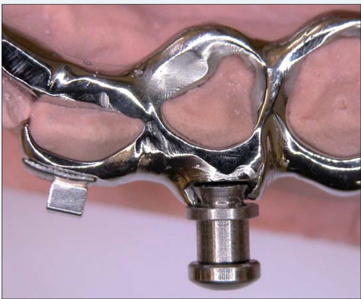
Abb. 3: Gewinde-Detail.