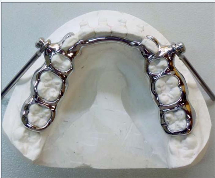
Abb. 2: Klassisches Herbst-Gerät im Unterkiefer mit adentalem Lingualbügel.