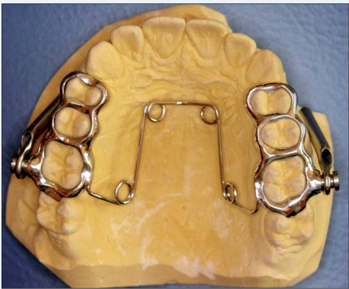
Abb. 4: Oberkiefer-Herbst-Apparatur mit Quadhelix.

Mehr denn je hat in den letzten Jahren die Digitalisierung in der Kieferorthopädie Einzug gehalten. Von Abdrücken über Modellherstellung und digitalem Set-up bis hin zu fertigen KFO-Geräten und Lingualtechnik ist inzwischen fast alles möglich. Bei all der Faszination dieser virtuellen Möglichkeiten bleibt es für den Kieferorthopäden jedoch nach wie vor wichtig, einen guten kieferorthopädischen Techniker an der Hand zu haben. Feinmotorische Handarbeit gepaart mit zahntechnischem Fachwissen und Erfahrung scheint trotz des digitalen technischen Fortschrittes unersetzlich zu bleiben.