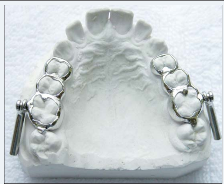
Abb. 1: Klassisches Herbst-Gerät im Oberkiefer.