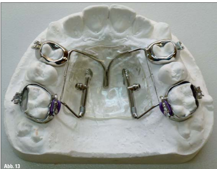
Abb. 12: Miniimplantatgestützter Distal-Jet. – Abb. 13: Distal-Jet mit gegossenen Bändern Regio 14 und 24.