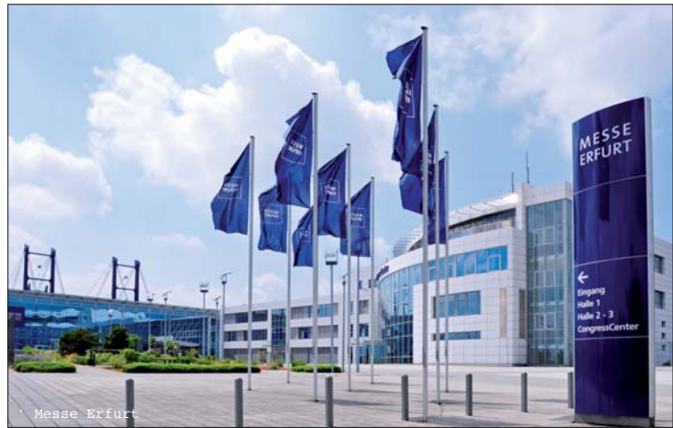
CongressCenter der Messe Erfurt.

medizin in der Erhaltung von Mundgesundheit und Funktion auch im hohen Alter zu sehen. Im Zusammenhang mit dem demografischen Wandel stellen sich daher viele unterschiedliche Fragen, z. B. ob unser dentales Behandlungs- und Versorgungsspektrum geändert werden muss oder wie man sich gegenüber älteren Patienten zu verhalten hat, die noch viele ihrer Zähne besitzen – eine Situation, mit der sich bereits Kollegen in Skandinavien konfrontiert sehen. Nationale sowie internationale Referenten wollen diese und