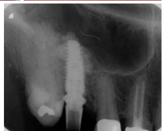
– Abb. 7: Applikation eines Tissue-Fleece® (Baxter) als innere Membran/Schutz. – Abb. 8: Einbringen des Knochenregenerationsmaterials und lockere Kondensation unter der Kieferhöhlenschleimhaut. – Abb. 9: Insertion eines Revois-Implantates 4,3/11 mm (curasan AG), transgingivaler Einheilungsmodus. – Abb. 10: Postoperative Kontrollaufnahme, Cave: mesial exzentrische Aufnahme!