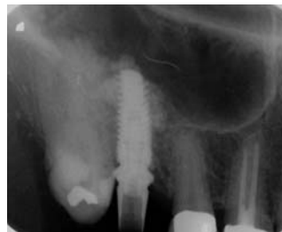
– Abb. 7: Applikation eines Tissue-Fleece® (Baxter) als innere Membran/Schutz. – Abb. 8: Einbringen des Knochenregenerationsmaterials und lockere Kondensation unter der Kieferhöhlenschleimhaut. – Abb. 9: Insertion eines Revois-Implantates 4,3/11 mm (curasan AG), transgingivaler Einheilungsmodus. – Abb. 10: Postoperative Kontrollaufnahme, Cave: mesial exzentrische Aufnahme!