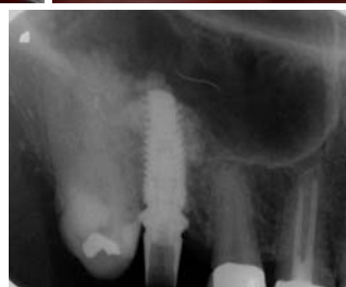
– Abb. 7: Applikation eines Tissue-Fleece® (Baxter) als innere Membran/Schutz. – Abb. 8: Einbringen des Knochenregenerationsmaterials und lockere Kondensation unter der Kieferhöhlenschleimhaut. – Abb. 9: Insertion eines Revois-Implantates 4,3/11 mm (curasan AG), transgingivaler Einheilungsmodus. – Abb. 10: Postoperative Kontrollaufnahme, Cave: mesial exzentrische Aufnahme!