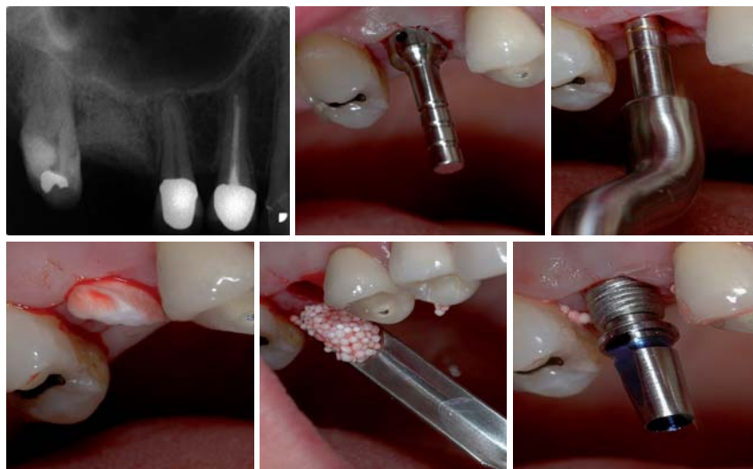
Falldarstellung: Ridge Preservation und Spätimplantation Regio 16 mit minimalinvasiver, geschlossener Sinusbodenelevation (Osteotomtechnik) – Abb. 4: Endodontischer Misserfolg Zahn 16, schonende Entfernung (Periotomtechnik) unter Erhalt der bukkalen Knochenlamelle, Alveolar Ridge Preservation, Zustand sechs Monate nach Einheilung. – Abb. 5: Schleimhautstanzung, Pilotbohrung 1,5 mm bis 2 mm unter kortikalen Boden des Sinus maxillaris und 3-D-Positionskontrolle. – Abb. 6: Nichtablative Implantatkavitätenaufbereitung Bone-Spreader Ø 2,0–2,7 mm à 2,7–3,2 mm (Stoma).

Klein Floyen 8-10 Tel.: 04324-89 29 - 0 D-24616 Brokstedt Fax.: 04324-89 29-29 www.schlumbohm.de post@schlumbohm.de