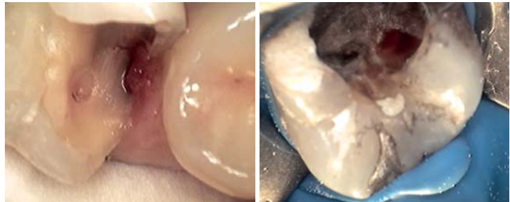
Abb. 1 und 2: Intraoralkameraaufnahmen – Kariöse Läsionen an vitalen Zähnen nach PolyBur-Exkavation (links) und Sandstrahlen. PolyBur-Exkavation (rechts) mit eröffneter Pulpa. Beides wurde schmerzarm und ohne Injektion durchgeführt.