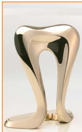
Auch dieses Jahr wird wieder der Journalistenpreis „Abdruck“ ...

Der Kommunikationspreis wird alle zwei Jahre verliehen. Erzeichnet lokale und regionale Aktionen sowie Kam-