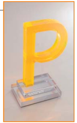
... sowie der proDente-Kommunikationspreis auf der IDS verliehen.

Neben dem Zahnlexikon können Messebesucher das „proDente Erinnerungsspiel“ am Messestand von proDente testen. Das Erinnerungsspiel ist ein Geschenk für Zahn techniker und Zahnärzte, das den kleinen und großen Patienten die Zeit im Wartezimmer vertreiben soll. Neben der gedruckten Variante gibt es eine Online-Version auf www.prodente.de . Diese Fassung können Fachleute auch auf ihren Internetseiten einbinden. Der Clou: Das Spiel steht auf der IDS außerdem als App für den Tablet-Computer iPad zur Verfügung. „Die Messebesucher können das Erinnerungsspiel mit dem Touchscreen direkt auf dem Messestand spielen“, erklärt Kropp. Wer in kurzer Zeit die meisten Paare von Nilpferd, Löwe und Co. findet, hat gewonnen.