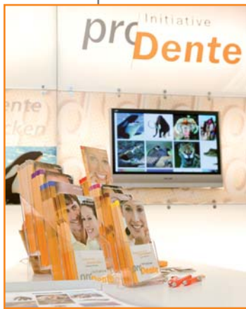
An den fünf Messtagen präsentiert proDente ein umfangreiches und kostenfreies Sortiment an Broschüren und Multimedia-Produkten zur Patientenaufklärung.