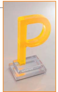
... sowie der proDente-Kommunikationspreis auf der IDS verliehen.