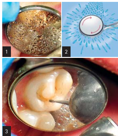
Abb. 1: Ein herkömmlicher Mundspiegel muss bereits nach wenigen Sekunden abgewischt werden. – Abb. 2: Glasklares Prinzip: Ein Mikromotor mit 15.000 Umdrehungen in der Minute dreht die Spiegeloberfläche und schleudert so Wasser, Schmutz und Blut einfach weg. – Abb. 3: Mit dem EverClear™ erleben Sie über die gesamte Behandlungsdauer die Annehmlichkeit, beständig und detailgenau zu sehen.

Präparationsset, welches mit Kühlt spray eingesetzt wird – egal ob es sich hierbei um ein Schnellaufwinkelstück, ein Turbinenwinkelstück oder ein Ultraschallhandstück handelt. EverClear™ fügt sich nahtlos in den Hygienekreislauf dieser Instrumente ein. Er entspricht selbstverständlich