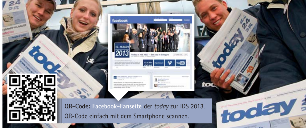
QR-Code: Facebook-Fanseite der today zur IDS 2013. QR-Code einfach mit dem Smartphone scannen.

Um den Messebesuch optimal zu planen, stehen den Besuchern zahlreiche digitale Services zur Verfügung. So steht das Update der eigenen IDS-App für iPhone, Blackberry und weitere Betriebssysteme über die IDS-Website zum kostenlosen Download bereit. Diese App beinhaltet den Messekatalog und ein Navigationssystem für mobile Endgeräte. Dadurch führt die App die Besucher zielsicher durch die Hallen und zu den gewünschten Messeständen. Außerdem bietet die App Informationen zu den Gastronomieangeboten, den Services vor Ort und dem Rahmenprogramm der IDS. So können die Besucher unterwegs oder in den Messehallen jederzeit auf wichtige Informationen zugreifen. Zu den digitalen Services zählt auch das Business-Matchmaking 365. Dahinter verbirgt sich eine Kommunikations- und Businessplattform, die es Besuchern und Ausstellern ermöglicht, schon vor Beginn der IDS 2013, aber auch noch danach, in direkten Kontakt miteinander zu treten. Im Vorfeld der Veranstaltung können die Besucher über den Online-Terminplaner auch per E-Mail Terminanfragen an Aussteller schicken, während der Online-Wegplaner einen individuellen Besuchsplan inklusive bestmöglicher Route durch die Hallen zusammenstellt. Zu den besonderen Serviceangeboten der Koelnmesse gehört auch der Infoscout, das webbasierte Informationssystem für IDS-Besucher. Es lässt sich kostenlos mit dem Webbrowser über das WLAN-Netz in den Messehallen erreichen.