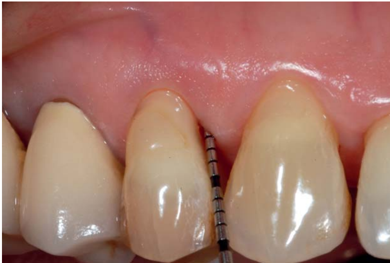
Abb. 1: Ermitteln der Taschentiefe und der Entzündung mittels einer Parodontalsonde North Carolina, Fa. Stoma, Liptingen. Durch die im Vorfeld durchgeführte Initialtherapie ist die Entzündung minimal.

Wurzeloberfläche aus. 18,30,37,45,55,56 An dieser Stelle sollte dem Praktiker klar werden, dass verbesserte klinische und radiologische Parameter auf histologischer Ebene keinen Prozess einer Regeneration bestätigen. 5,58 Der Mechanismus, wie ein Knochenersatzmaterial die parodontale Regeneration beeinflusst, beruht wahrscheinlich auf der Stabilisierung des Blutkoagulums und in der Verhinderung eines Lappenkollapses. 36,43,61 Bei der Verwendung von einem Knochenersatz – nicht nur in der regenerativen Parodontaltherapie – sollte somit die Auswahl des Materials aufgrund von biologischen Überlegungen erfolgen. Hierbei ist im Bereich der Parodontologie zu beachten, dass Evidenz eines histologischen Nachweises einer