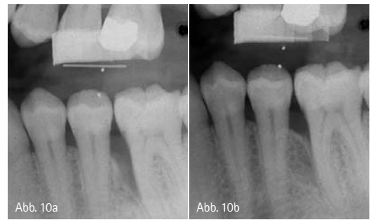
Abb. 10a und b: Radiografische Darstellung eines dreiwandigen Knochendefektes (Defekt aus Abb. 8) vor und nach zwölf Monaten nach Behandlung mit Schmelz-Matrix-Proteinen (Emdogain®, Straumann, Basel, Schweiz); 10a) Baseline; 10b) Nach zwölf Monaten.

Obwohl flache Knochendefekte das gleiche regenerative Potenzial besitzen wie tiefe Defekte, können größere Attachmentgewinne bei der Behandlung von Defekten tiefer als drei Millimeter beobachtet werden. Weiterhin steigt das regenerative Potenzial eines Defektes mit der Anzahl der begrenzenden Knochenwände. So haben dreiwandige Defekte eine bessere Prognose als zwei- oder einwandige Knochendefekte. Knochendefekte, die röntgenologisch einen Winkel zwischen Defektwand und Zahnachse von weniger