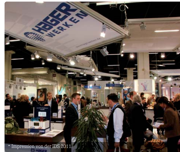
* Impression von der IDS 2011.

Ab Mai 2013 wird das Recapping von Nadeln in der Praxis untersagt. Daher erfolgt eine besondere Beratung zum Thema „Vermeidung von