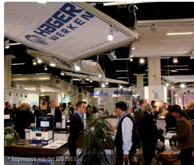
* Impression von der IDS 2011.

Ab Mai 2013 wird das Recapping von Nadeln in der Praxis untersagt. Daher erfolgt eine besondere Beratung zum Thema „Vermeidung von