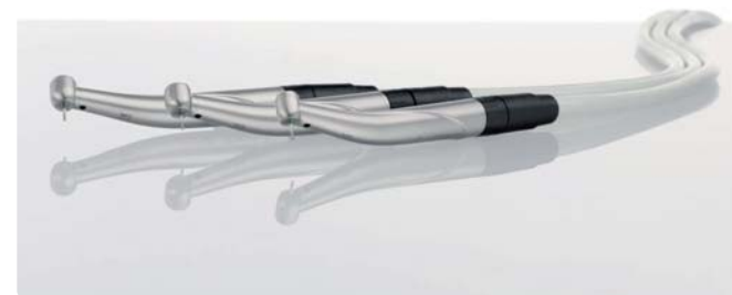
* Leistungsstärker und trotzdem leiser: Die neue Turbinenfamilie T1 Premium mit den drei Varianten Boost, Minikopf und CONTROL.

und ermöglicht so ein konstantes Arbeiten bei höherer Laufruhe und vermeidet zugleich thermische Schäden am Zahn.