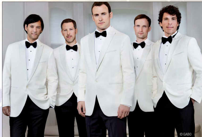
• Adoro. • Adoro.

Die auch als „Indie Lindie“ bekannte kanadische Sängerin wird immer noch als Geheimtipp gehandelt, obwohl sie bereits seit über einem Jahrzehnt durch die nordamerikanische Musikszene tingelt. Ihr letztes Album, das 2012 vom Plattenlabel Last Gang Records in Toronto veröffentlicht wurde, konnte sich sogar auf Platz 72 der US Charts platzieren. International bekannt wurde sie durch ihre Zusammenarbeit mit The Killers-Frontmann Brandon Flowers.