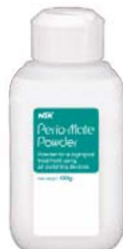
Perio-Mate Powder Powder for subgingival treatment using air-polishing devices