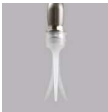
Flexible plastic nozzle tip design ensures accessibility and is gentle to the gums

The combination of the Perio-Mate's slim nozzle and fine, thin and flexible plastic nozzle tip makes procedures safer and offers optimal visibility and operability at the same time. The nozzle tip's shape and composition are user friendly and enable thorough and easy access to soft tissues, ensuring comfortable treatment.