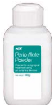
Perio-Mate Powder Powder for subgingival treatment using air-polishing devices