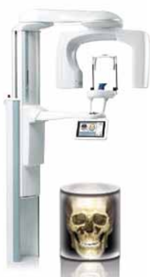
Planmeca ProMax ® 3D