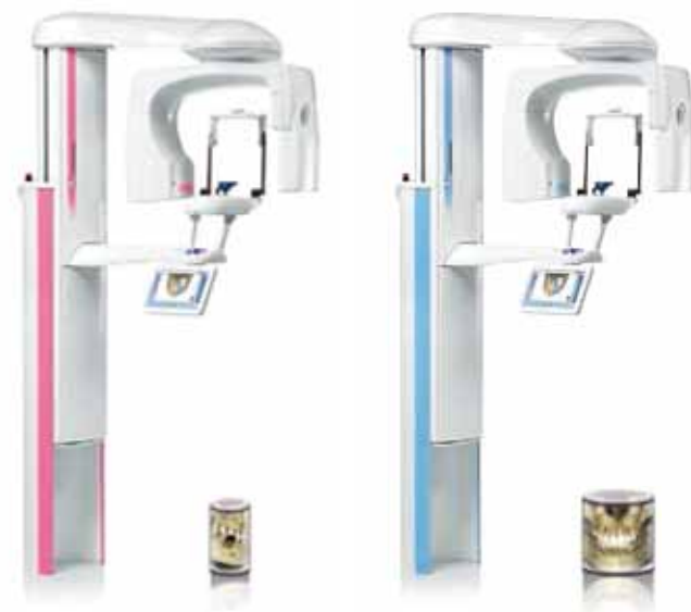
Planmeca ProMax® 3D s