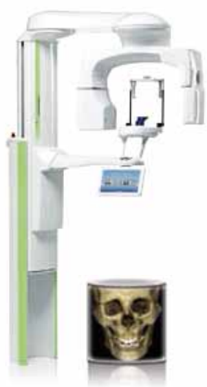
Planmeca ProMax ® 3D s