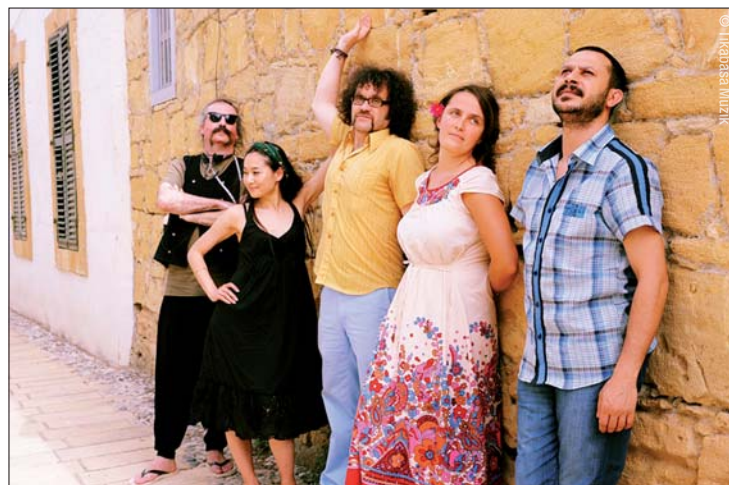
• BaBa ZuLa. • BaBa ZuLa.

The multifaceted music scene of the Turkish metropolis of Istanbul became widely known in the Western hemisphere through the recent documentary film Crossing the Bridge: The Sound of Istanbul by German-Turkish director Fatih Akin. One of its most prominent examples is probably BaBa ZuLa, who also made a brief appearance in the movie. The group's music combines traditional Turkish instruments with dub rhythms and psychedelic sounds of the 1960s. Moreover, the audience can look forward to a colourful evening with costumes, theatrical elements and live painting. ◀