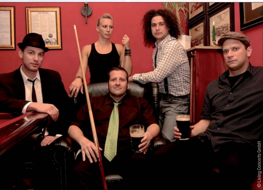
• Mr. Irish Bastard & Special Guest. • Mr Irish Bastard and special guest.

Was Köln am Freitag sonst noch alles zu bieten hat Some tips on enjoying your time off on Friday