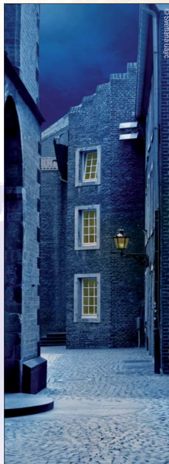
• Kölner Nachtwächterführung.

Mitunter kreuzen Schlitzohren, Gaukler und so manche Hübschlerin seinen Weg und so kann er einige Geschichten erzählen. Man erfährt so zum Beispiel, was Goldgräber des Nachts in Kölner Straßen tun, was es mit Torchlusspanik und Zapfenstreich auf sich hat und warum der kluge Mann immer an der Wand lang geht. ◀