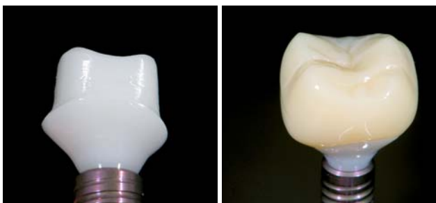
Abb. 11: Zirkoniumdioxid-Abutment aus gehiptem Zirkon. – Abb. 12: Vollanatomische Krone aus PMMA.