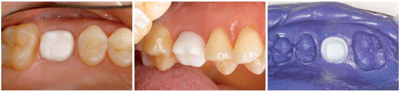
Abb. 17 und 18: Verblendkappchen – okklusale und vestibuläre Ansicht. – Abb. 19: Verblendkappchen in Überabformung (Polyether-Abformmaterial).