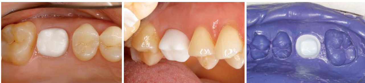
Abb. 17 und 18: Verblendkäppchen – okklusale und vestibuläre Ansicht. – Abb. 19: Verblendkäppchen in Überabformung (Polyether-Abformmaterial).