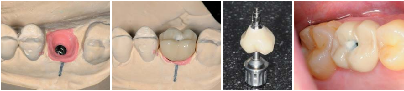
Abb. 5: Modell mit idealisierter Schleimhautmaske. – Abb. 6: Provisorischer Zahnersatz im Modell. – Abb. 7: Provisorischer Zahnersatz auf Einbringsschlüssel. – Abb. 8: Provisorischer Zahnersatz in situ.

Es kam anfänglich zu einer deutlichen Verbesserung des Befunds, jedoch entwickelte sich im Jahre 2010 eine erneute Fistel. Darauf erfolgte eine Dentalmikroskop-gestützte orthograde Revision der Wurzelfüllung. Im Verlauf der Revisionsbehandlung konnte ein zusätzlicher Wurzelkanal erschlossen werden, die Fistel bildete sich bereits nach einigen Tagen zurück, die palatinale Wurzel wurde mit Guttapercha und die bereits resezierten Wurzeln mittels MTA-Angelus (Angelus, Londrina, PR, Brazil) orthograd gefüllt. Die Röntgenkontrolle nach sechs Monaten zeigte eine fast vollständige Reossifikation der apikalen Läsion, klinisch war der Zahn vollkommen unauffällig. Anfang 2011 zeigte sich im Rahmen einer durchgeführten Prophylaxebehandlung bei Inspektion des Zahnes eine mesial lokal deutlich erhöhte Sondierungstiefe sowie eine Pus-Entleerung im Bereich der palatinalen Wurzel des Zahns. Es bestand aufgrund der Symptomatik der Verdacht auf eine Wurzellängsfraktur der mesiobukkalen Wurzel, der Zahn wurde daraufhin entfernt und die Längsfraktur sicher bestätigt.