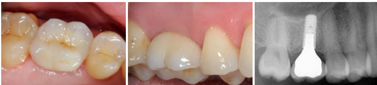
Abb. 20: Okklusale Ansicht der definitiven Versorgung. – Abb. 21: Vestibuläre Ansicht der definitiven Versorgung. – Abb. 22: OPG-Ausschnitt – 24 Monate nach Implantatinsertion.