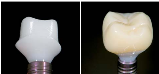
Abb. 11: Zirkoniumdioxid-Abutment aus gehiptem Zirkon. – Abb. 12: Vollanatomische Krone aus PMMA.