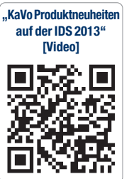
„KaVo Produktneuheiten auf der IDS 2013“ [Video]