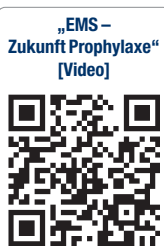
„EMS – Zukunft Prophylaxe“ [Video]