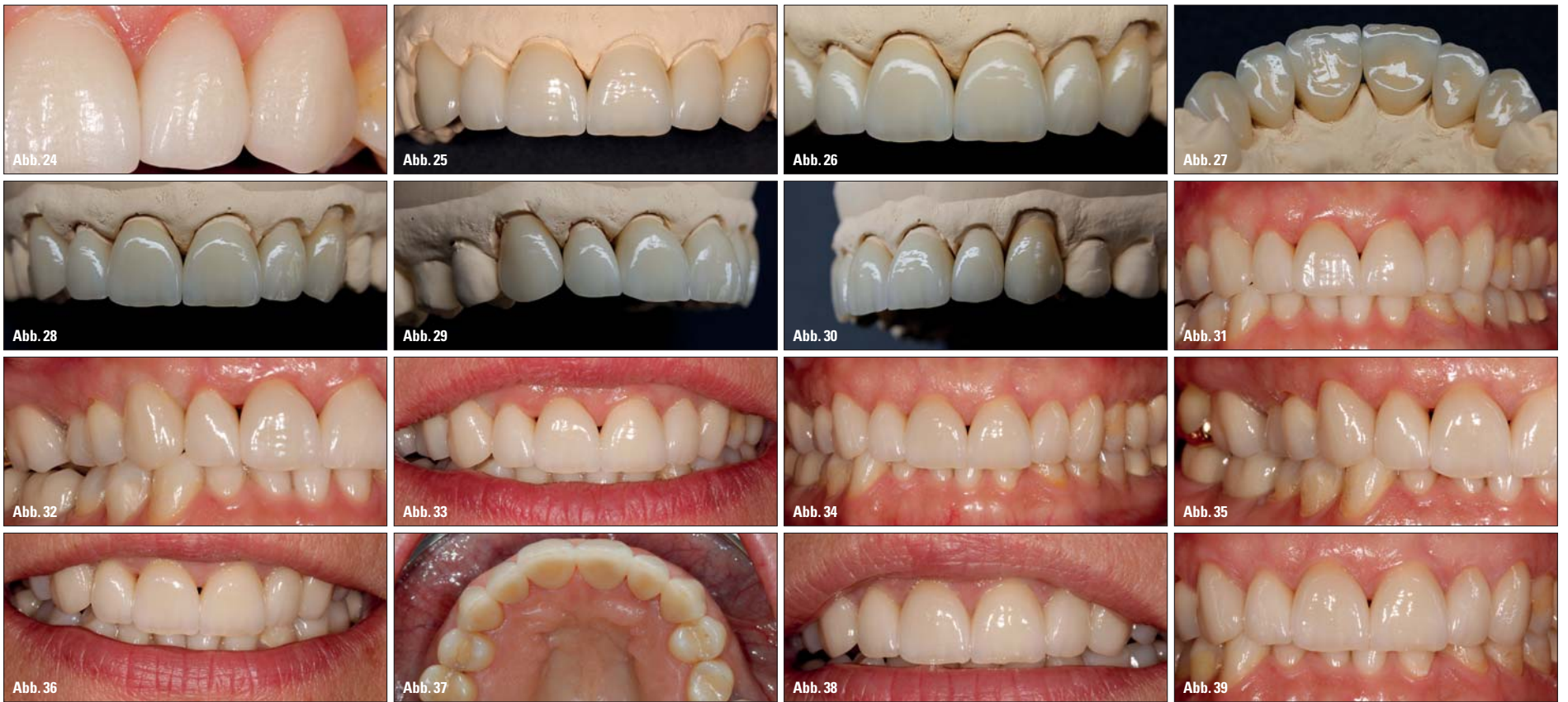
Abb. 25–30: Die fertigen Kronen auf dem Kontrollmodell. – Abb. 31–33: Detailaufnahmen der Papillen direkt nach dem Einsetzen. – Abb. 34–37: Nachkontrolle der Arbeit eine Woche nach Eingliederung. – Abb. 38: Situation etwa fünf Monate nach Eingliederung. – Abb. 39: Nach fünf Monaten in situ entstand nach dem Abblasen mit Druckluft nur noch ein kleines schwarzes Dreieck zwischen den OK-Einsern.

zung, desto wahrscheinlicher sind auch entsprechende Verfärbungen.