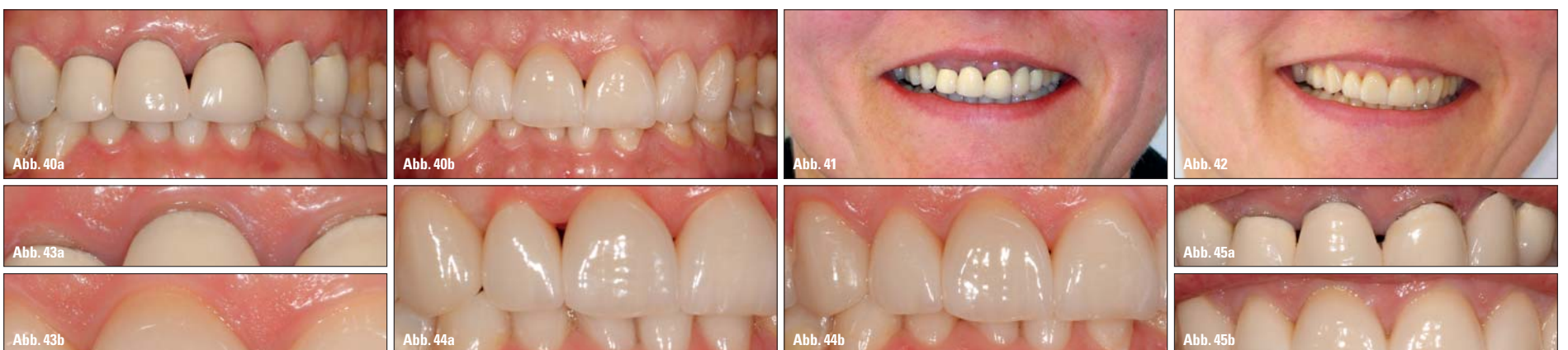
Abb. 40a und b: Vorher-Nachher-Situation im Vergleich. – Abb. 41: Patientin mit der alten Versorgung durch Metallkeramikronen. – Abb. 42: Patientin nach dem Einsetzen der neuen e.max-Kronen. – Abb. 43a und b: Detailaufnahme der etwas freiliegenden Zahnhälse, im oberen Bild ist deutlich die dunkle Verfärbung der Zahnwurzel zu erkennen; in der Abbildung 43b haben die Krone und der Zahnhals absolut dieselbe Farbe und Transparenz, dieses Ergebnis wäre mit Zirkonkronen nicht möglich gewesen, dafür hätte subgingival präpariert werden müssen (WICHTIG! Die Zähne wurden nicht gebleicht!). – Abb. 44a und b: Regeneration der Interdentalpapillen vom Einsetzen der Versorgung (a) und nach fünfmonatiger Tragedauer (b). – Abb. 45a und b: Zahnfleischsituation vor Behandlungsbeginn (a) und fünf Monate nach dem Eingliedern der Kronen (b).