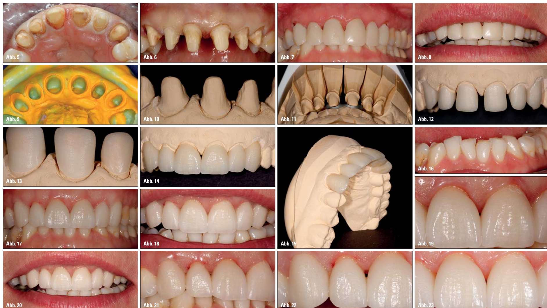
Abb. 5: Präparation mit eingelegten Retraktionsfäden von okkusal. – Abb. 6: Präparation mit eingelegten Retraktionsfäden, relativ gleichmäßige Stumpffarbe. – Abb. 7 und 8: Provisorium in situ mit ausgesparten Papillenbereichen. – Abb. 9: Abformung aus Aquasil Ultra. – Abb. 10: Detailaufnahme des Kontrollmodells. – Abb. 11: Okklusale Platzkontrolle am Modell. – Abb. 12: Die fertigen e.max-Käppchen auf dem Kontrollmodell. – Abb. 13: Detailaufnahme der Käppchenränder auf dem Kontrollmodell. – Abb. 14 und 15: Der fertige Rohbrand auf dem Kontrollmodell. – Abb. 16: Detailaufnahme der UK-Front als Hilfe zum Schichten. – Abb. 17–19: Rohbrandeinprobe, Kronen in situ. – Abb. 20: Farbeindruck mit Einbezug der Lippen. – Abb. 21–24: Kontrolle der Interdentalpapillen.

gutachten. Bei vielen Menschen fallen uns dabei nicht zuerst die gut oder weniger gut hergestellten Kronen im Frontzahnbereich auf, sondern ein völlig unnatürlich grau oder lila verfärbtes