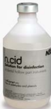
n.cid Bakterizid Fungizid Viruzid