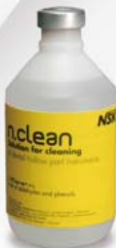
n.clean Bakteriostatisch Fungistatisch Reinigend