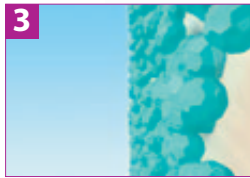
3 Der geschützte und remineralisierte Zahn