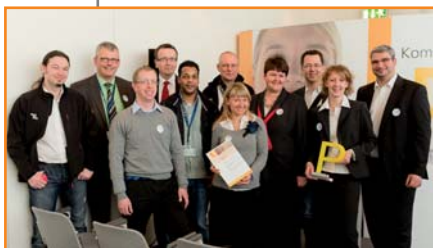
Die Preisträger „Milchzähne machen mobil e.V.“

Die Initiative proDente e. V. hat 2013 zum dritten Mal den Kommunikationspreis, der erfolgreiche PR- und Marketing-Aktivitäten von Zahnärzten und Zahntechnikermeistern auszeichnen möchte, vergeben. Die feierliche Verleihung fand im Rahmen der 35. Internationalen Dental-Schau am 13. März 2013 in Köln statt. Der Preis für den besten Printbeitrag wurde in diesem Jahr an die Zahnarztpraxis Schöler aus Söhrewald verliehen. Die Praxis bewirbt ihr Motto „Zahngesundheit statt Reparaturmedizin“ in einer Printkampagne: Mit zielgerichteten