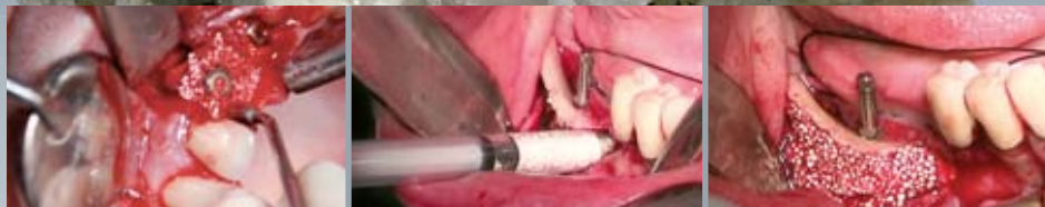
synthetic bone graft solutions - Swiss made