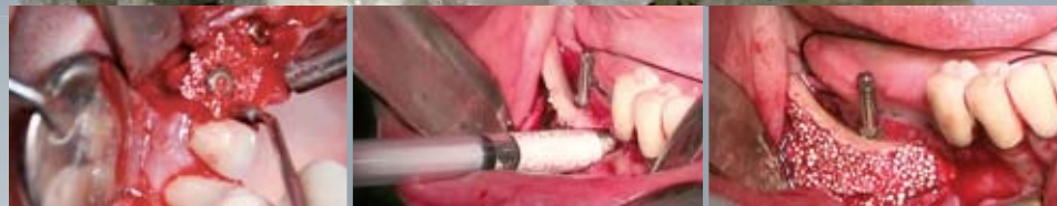
synthetic bone graft solutions - Swiss made