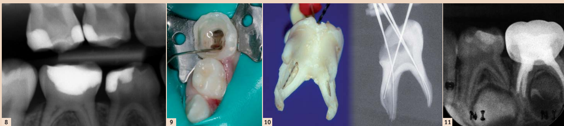
Abb 8: Röntgenbild, Zahn 55 überkappt und Zahn 85 pulpaamputiert mit Portland Zement. – Abb 9: Zahn 75, Spülung mit Natriumhypochlorit während einer Pulpotomie. – Abb 10: Anatomie eines Milch-5ers, welche den Gebrauch von Wurzelbehandlungsinstrumenten verbietet. – Abb 11: Zahn 75 mit Vitapex-Wurzelfüllung.

„Indirect Pulp Treatment“ Verfahren zur einzeitigen als auch zur schrittweisen Kariesentfernung verstanden. Bei der schrittweisen Kariesentfernung wird, um einer Pulpaeröffnung vorzubeugen, erweichtes Dentin unter einem dichten Kavitätenverschluss belassen. Manche Schulen akzeptieren sogar das permanente Belassen von kariösem Restdentin unter allerdings strikt geforderten, absolut dichten Füllungen. Eine besondere Bedeutung kommt hierbei dem Unterfüllungsmaterial zu. Auch hier hat sich MTA/PC den kalziumhydroxid- und zinkoxid-eugenolhaltigen Präparaten überlegen gezeigt. Bei einem schrittweisen Vorgehen wird eine Reintervention in der Regel nach sechs Monaten empfohlen. Als besonders erfolgreich, aber auch sehr kontrovers, wird die sogenannte „Hall-Technik“ in England diskutiert. Bei dieser Technik werden kariöse Milchzähne ohne weitere, größere Behandlung mit SS-Edelstahl-Kronen überdeckt. 7,15,27