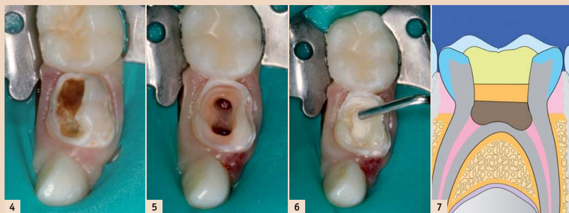
Abb 4: Karies profunda an einem Zahn 74. – Abb 5: Gleicher Zahn 74, Pulpa amputiert. – Abb 6: Portland Zement wird in das Pulpakavum des Zahns 74 eingebracht. – Abb 7: Schematische Darstellung einer Pulpaamputation mit Portland Zement, GIZ und Composite-Adhäsivfüllung.

dig bis zum harten möglicherweise noch verfärbten Dentin entfernt und mit einer Restauration wieder verschlossen. Die Pulpa sollte symptomfrei sein und die Kavität frei von weicher Restkaries. Das freigelegte Dentin kann mit einem therapeutisch wirksamen Unterlagsmaterial versorgt werden, bevor es mit einer restaurativen Füllung dicht verschlossen wird. Die therapeutisch eingesetzten Materialien können kalziumhydroxid- und zinkoxid-eugenolhaltige Präparate sein. Ebenso kommen seit längerer Zeit MTA oder Portland Zement-Materialien (MTA/PC) zum Einsatz. Das Unterfüllungsmaterial sollte idealerweise eine Stimulation von Reizdentin bewirken, mögliche Restmikroorganismen inaktivieren, als eigenständiges Material möglichst bakteriedicht und in der Anschaffung erschwinglich sein. Solche „Unterfüllungen“ sollten danach möglichst zeitgleich mit einer dichten Restauration über-