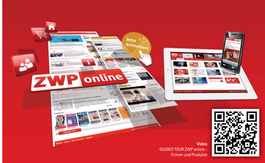
Video GUIDED TOUR ZWP online - Firmen und Produkte

OEMUS MEDIA AG Tel.: 0341 48474-0 www.oemus.com