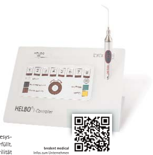
bredent medical Infos zum Unternehmen

Anwendung dieser Therapie zur Behandlung biofilmassoziierter oraler Infektionen. Voraussetzung für die Kostenerstattung ist, dass das eingesetzte Therapiesystem bestimmte Anforderungen erfüllt. So wird beispielsweise die Sterilität der eingesetzten Materialien zwingend gefordert. Der Wirkstoff in der Photosensitizerlösung soll innerhalb einer relevanten Bandbreite konzentriert sein und muss durch einen Diodenlaser mit einer Ausgangsleistung von 90 bis 140 mW aktiviert werden. Die Abstrahlungswellenlänge soll im Bereich von 650 bis 670 nm liegen und den Photosensitizer durch dreidimensional abstrahlende Lichtleiter direkt in der Tasche anregen. All diese Krite-