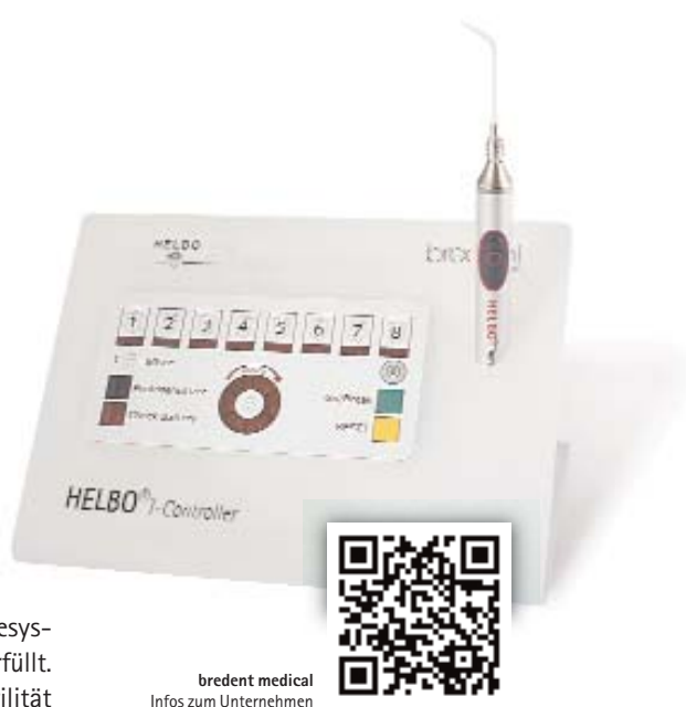
breident medical Infos zum Unternehmen

Anwendung dieser Therapie zur Behandlung biofilmassoziierter oraler Infektionen. Voraussetzung für die Kostenerstattung ist, dass das eingesetzte Therapiesystem bestimmte Anforderungen erfüllt. So wird beispielsweise die Sterilität der eingesetzten Materialien zwingend gefordert. Der Wirkstoff in der Photosensitizerlösung soll innerhalb einer relevanten Bandbreite konzentriert sein und muss durch einen Diodenlaser mit einer Ausgangsleistung von 90 bis 140 mW aktiviert werden. Die Abstrahlungswellenlänge soll im Bereich von 650 bis 670 nm liegen und den Photosensitizer durch dreidimensional abstrahlende Lichtleiter direkt in der Tasche anregen. All diese Krite-