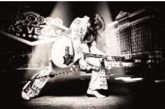
Der King lebt(e) – in Bad Nauheim!