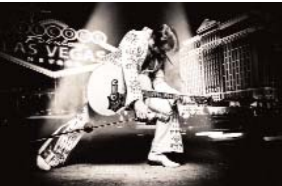
Der King lebt(e) – in Bad Nauheim!