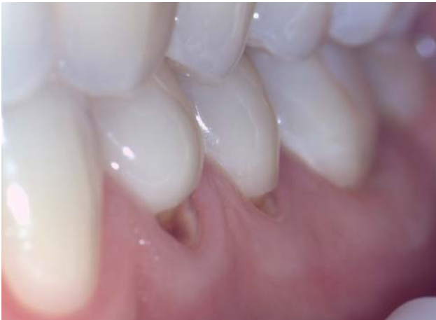
Abb. 3: Darstellung eines Zahnalsdefektes zur Patientenaufklärung.

Wechsel auf die Lupenbrille zwischenzeitlich sogar auf die Behandlungsleuchte verzichtet werden, da die Lichtquelle des hochgeschwenkten Dentalmikroskops ausreichend ist.