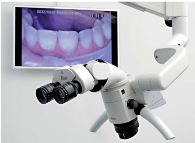
Abb. 2: Das Dentalmikroskop bietet gute Dokumentationsmöglichkeiten über die Koppelung an einen externen Monitor.

Behandler, der mit einem solchen Gerät nicht glücklich wird und es durch die unbefriedigende Sicht und fehlende Integration alsbald immer seltener oder aber zumindest lustloser nutzen wird. Und zweitens beim Patienten, da dieser nicht in den Genuss der Vorzüge einer mikroskopgestützten hochwertigen Behandlung kommt. Dabei ist so viel mehr möglich! Es ist eben wie bei so vielen Dingen – der Spaß kommt erst mit einer gewissen Qualität.