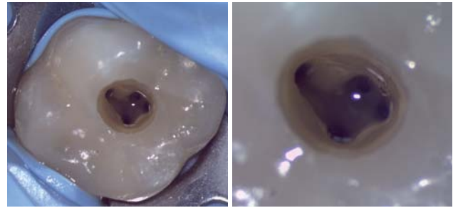
Abb. 4: Vorhersagbare Aufbereitung des mb2-Kanals.

Ein Mikroskop ist in erster Linie ein optisches Gerät; dementsprechend sollten weder der Preis noch andere Punkte einen dazu veranlassen, bei der Qualität der optischen Bestandteile Abstriche zu machen. Sicherlich sind unter diesem Gesichtspunkt preisgünstige Nachbauten von Mikroskopen renommierter Hersteller eher kritisch zu sehen. Sehr schön ist es zudem, wenn das Mikroskop die Möglichkeit einer Autofokusfunktion bietet. Diese erspart dem Behandler die Feinjustierung über zum Beispiel Feinfokusringe, aber wie bei vielen an-