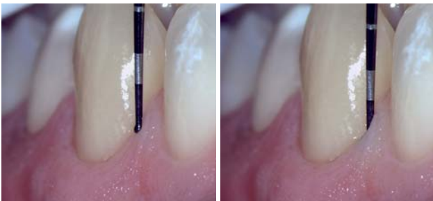
Abb. 1a und b: Parodontale Diagnostik – Ideale Patientenkommunikation über Mikroskopbilder möglich.

Der Praxisinhaber bemerkte beim Studium der neuen GOZ, dass wiederholt die Abrechnungsmöglichkeit des Mikroskops auftaucht, was ihn dazu veranlasste, sich ein möglichst günstiges Gerät anzuschaffen, um den Honorarbereich nicht ungenutzt an sich vorbeiziehen zu lassen. Frust ist hier vorprogrammiert. Erstens beim