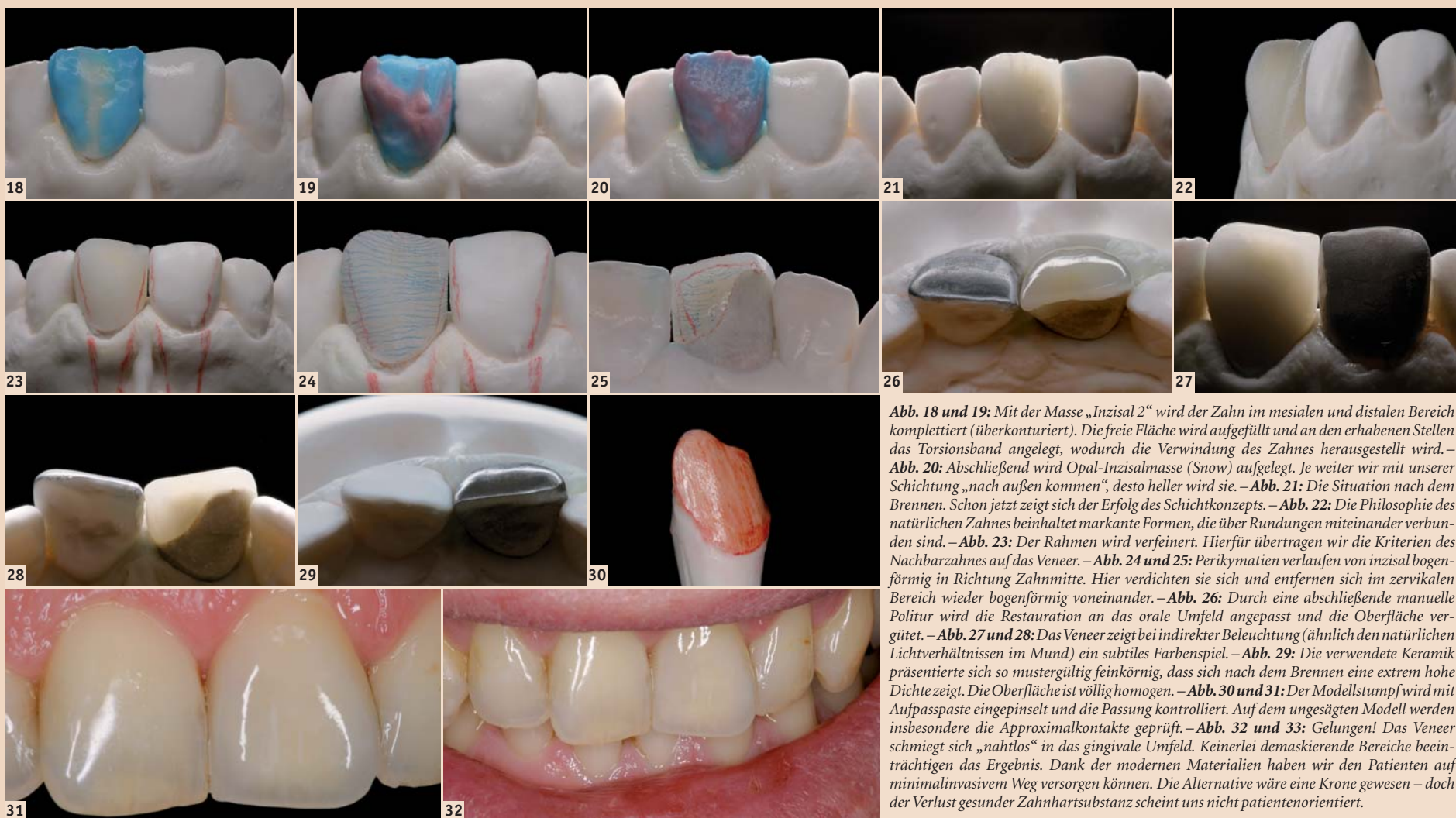
Abb. 18 und 19: Mit der Masse „Inzisal 2“ wird der Zahn im mesialen und distalen Bereich komplettiert (überkonturiert). Die freie Fläche wird aufgefüllt und an den erhabenen Stellen das Torsionsband angelegt, wodurch die Verwindung des Zahnes herausgestellt wird. – Abb. 20: Abschließend wird Opal-Inzismasse (Snow) aufgelegt. Je weiter wir mit unserer Schichtung „nach außen kommen“, desto heller wird sie. – Abb. 21: Die Situation nach dem Brennen. Schon jetzt zeigt sich der Erfolg des Schichtkonzepts. – Abb. 22: Die Philosophie des natürlichen Zahnes beinhaltet markante Formen, die über Rundungen miteinander verbunden sind. – Abb. 23: Der Rahmen wird verfeinert. Hierfür übertragen wir die Kriterien des Nachbarzahnes auf das Veneer. – Abb. 24 und 25: Perikymatien verlaufen von inzisal bogenförmig in Richtung Zahnmitte. Hier verdichten sie sich und entfernen sich im zervikalen Bereich wieder bogenförmig voneinander. – Abb. 26: Durch eine abschließende manuelle Politur wird die Restauration an das orale Umfeld angepasst und die Oberfläche vergütet. – Abb. 27 und 28: Das Veneer zeigt bei indirekter Beleuchtung (ähnlich den natürlichen Lichtverhältnissen im Mund) ein subtiles Farbenspiel. – Abb. 29: Die verwendete Keramik präsentierte sich so mustergültig feinkörnig, dass sich nach dem Brennen eine extrem hohe Dichte zeigt. Die Oberfläche ist völlig homogen. – Abb. 30 und 31: Der Modellstumpf wird mit Aufpasspaste eingepinselt und die Passung kontrolliert. Auf dem ungesägten Modell werden insbesondere die Approximalkontakte geprüft. – Abb. 32 und 33: Gelungen! Das Veneer schmiegt sich „nahtlos“ in das gingivale Umfeld. Keinerlei demaskierende Bereiche beeinträchtigen das Ergebnis. Dank der modernen Materialien haben wir den Patienten auf minimalinvasivem Weg versorgen können. Die Alternative wäre eine Krone gewesen – doch der Verlust gesunder Zahnhartsubstanz scheint uns nicht patientenorientiert.

in destilliertes Wasser gelegt. Durch das Wässern kann die Feuchtigkeit der Keramik beim Schichten nicht vom trockenen Stumpfmateriale aufgesogen werden. Das erleichtert die Arbeit ungemein.