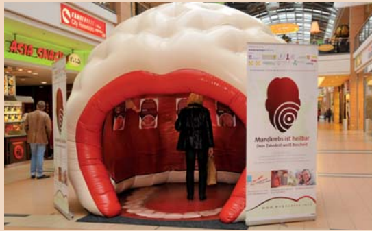
Das begehbare Mundmodell sorgt regelmäßig für Aufsehen.

Dazu musste aufwendige wissenschaftliche Vorarbeit geleistet werden. Neben der Ermittlung des repräsentativen Kenntnisstandes der Bevölkerung zu dieser Erkrankung und einer Zielgruppenerhebung nebst qualitativer Analyse von Probanden daraus, zählte auch eine