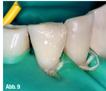
▲ Abb. 4: Umsetzung in der Praxis: Ausgangssituation. ▲ Abb. 5: Präparierter Zahn mit abgerundeten Kanten. ▲ Abb. 6: Phosphorsäureätzung ▲ Abb. 7: Aufgebaute palatinale Wand. ▲ Abb. 8: Gestaltung der Approximalfläche. ▲ Abb. 9: Aufgebauter Dentinkern.