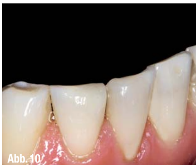
▲ Abb. 10: Das Ergebnis.

Begeistert von dem einfachen Konzept fuhr ich zurück in die Praxis und versorgte gleich am nächsten Morgen den ersten Patienten mit einer direkten Restauration nach Style Italiano. Der 54-jährige Patient stellte sich mit einer me-