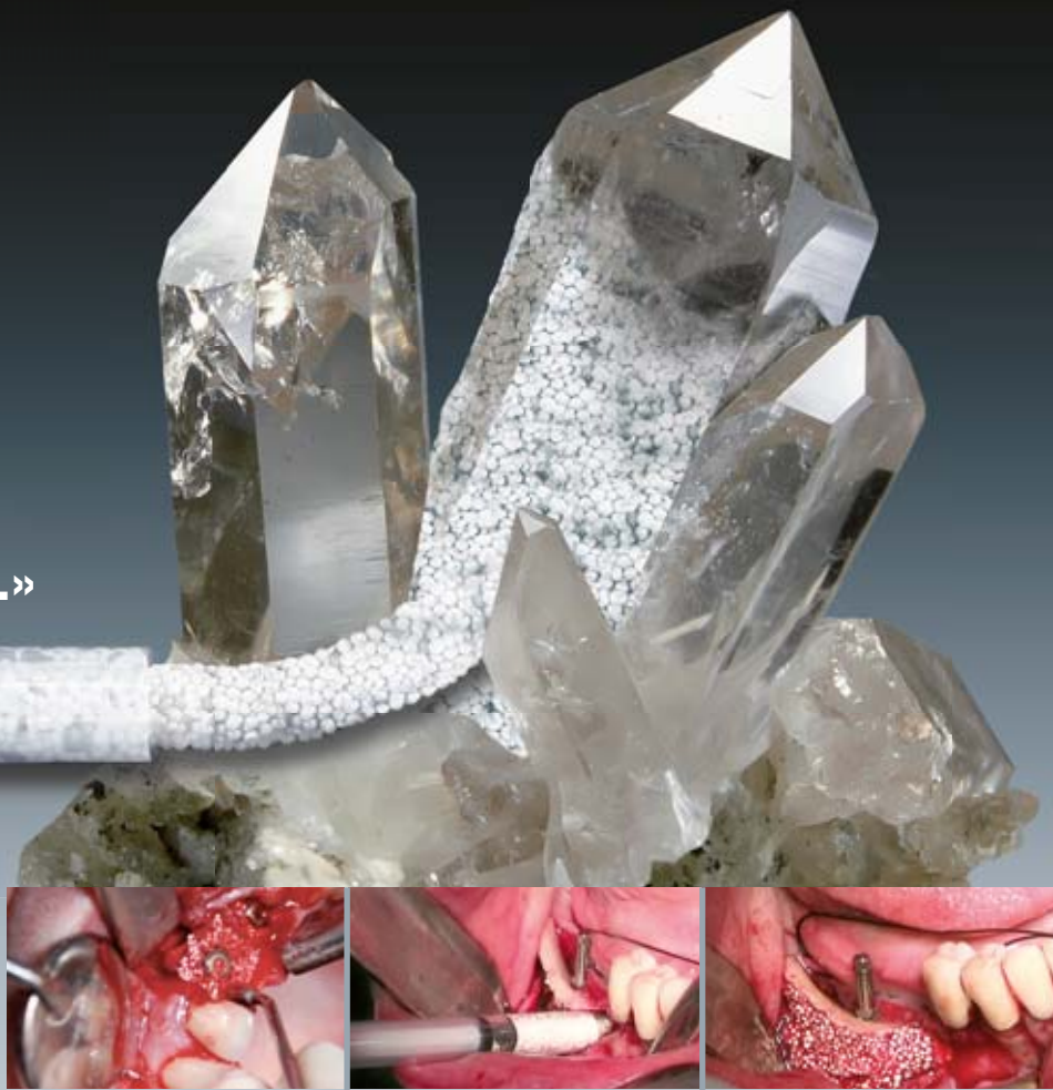
synthetic bone graft solutions - Swiss made