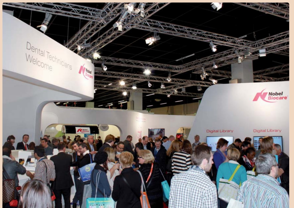
„Unsere Wachstumsstrategie baut auf drei strategischen Pfeilern: Innovative Produkte, Partnerschaft mit unseren Kunden und die Schulung.“