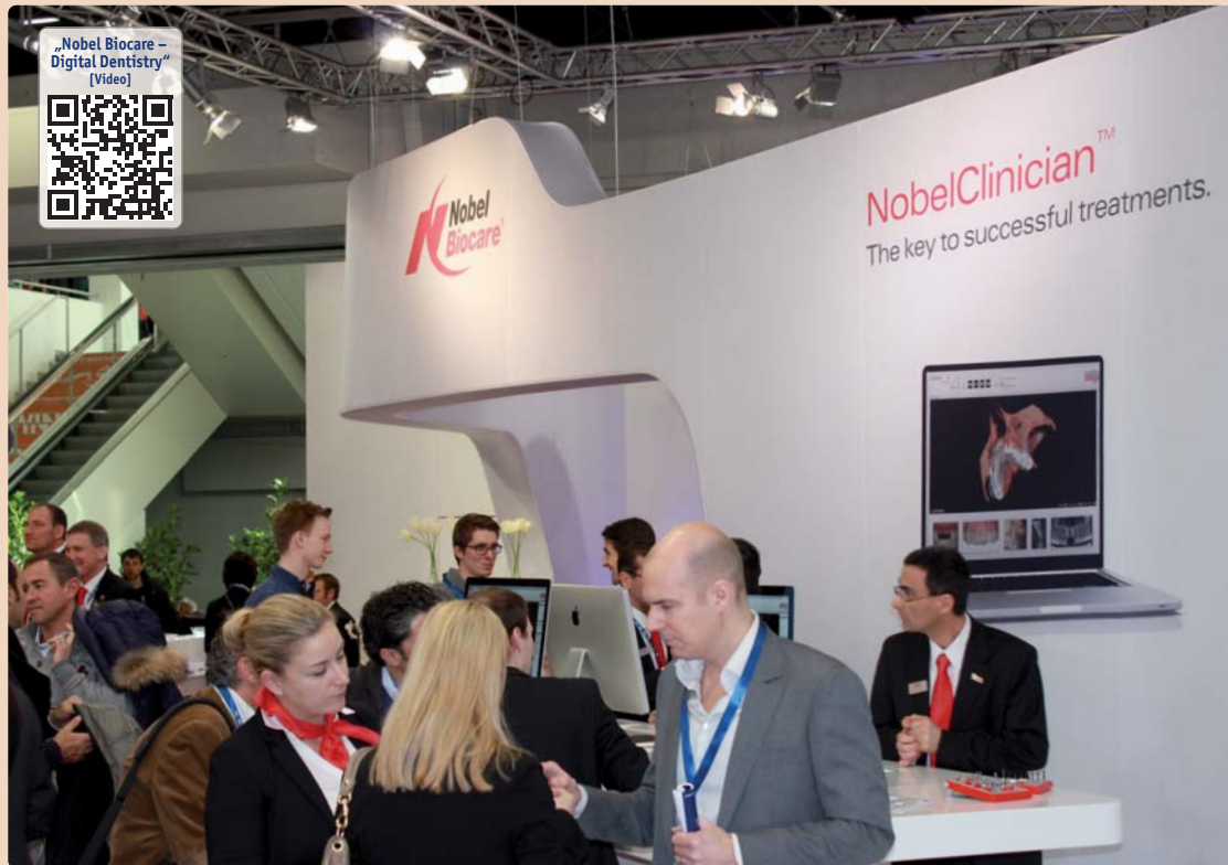
„Wir unterstützen unsere Kunden mit dem eigenen Anspruch, ein erstklassiges Produktangebot und hoch qualifiziertes Mitarbeiter-Team zu bieten.“

Es herrscht zunehmend Unsicherheit, besonders zu Fragen der Haftung und des Medizinproduktegesetzes. Sowohl der Behandler als auch der Patient sollten daher sehr sorgfältig auf langjährige Evidenz, Wissenschaftlichkeit und Erfahrung achten – eben auf den Standard eines globalen