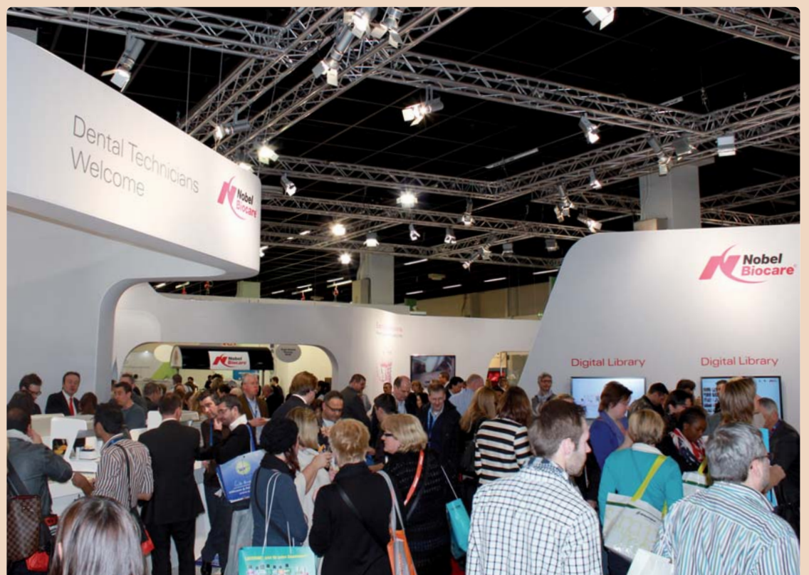
„Unsere Wachstumsstrategie baut auf drei strategischen Pfeilern: Innovative Produkte, Partnerschaft mit unseren Kunden und die Schulung.“