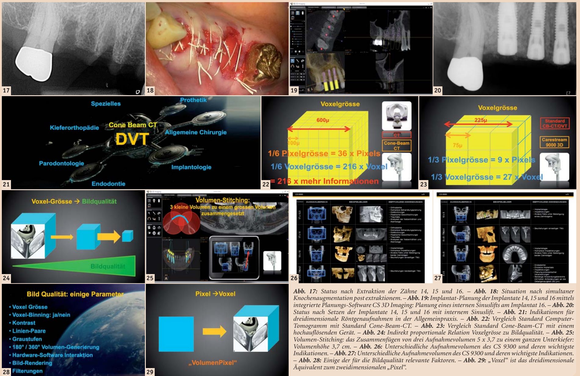
Abb. 17: Status nach Extraktion der Zähne 14, 15 und 16. – Abb. 18: Situation nach simultaner Knochenaugmentation post extraktionem. – Abb. 19: Implantat-Planung der Implantate 14, 15 und 16 mittels integrierte Planungs-Software CS 3D Imaging: Planung eines internen Sinuslifts am Implantat 16. – Abb. 20: Status nach Setzen der Implantate 14, 15 und 16 mit internem Sinuslift. – Abb. 21: Indikationen für dreidimensionale Röntgenaufnahmen in der Allgemeinpraxis. – Abb. 22: Vergleich Standard Computer-Tomogramm mit Standard Cone-Beam-CT. – Abb. 23: Vergleich Standard Cone-Beam-CT mit einem hochauflösenden Gerät. – Abb. 24: Indirekt proportionale Relation Voxelgröße zu Bildqualität. – Abb. 25: Volumen-Stitching: das Zusammenfügen von drei Aufnahmevolumen 5 x 3,7 zu einem ganzen Unterkiefer: Volumenhöhe 3,7 cm. – Abb. 26: Unterschiedliche Aufnahmevolumen des CS 9300 und deren wichtigste Indikationen. – Abb. 27: Unterschiedliche Aufnahmevolumen des CS 9000 und deren wichtigste Indikationen. – Abb. 28: Einige der für die Bildqualität relevante Faktoren. – Abb. 29: „Voxel“ ist das dreidimensionale Äquivalent zum zweidimensionalen „Pixel“.

die Aufnahmequalität bezüglich Detaildarstellung drastisch reduziert. So hat eine konventionelle CT-Aufnahme mit 600 µ Voxelkantenlänge im Vergleich zu einer hochauflösenden CB-CT-Aufnahme mit 100 µ Voxelkantenlänge eine 216 Mal höhere Auflösung ( 6 \times 6 \times 6 = 216 ), bei einer zurzeit maximal hochauflösenden CB-CT-Aufnahme mit 75 µ Voxelkantenlänge aber eine 512 Mal höhere Auflösung ( 8 \times 8 \times 8 = 512 ) und eine Aufnahme mit 100 µ Voxelkantenlänge zeigt im Vergleich zu einer mit 300 µ Voxelkantenlänge eine 27 Mal höhere Auflösung ( 3 \times 3 \times 3 = 27 )! Die Bildqualität und damit der Informationsgehalt der Aufnahmen werden also sehr stark von