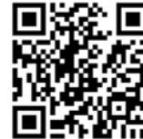
Dr. Kianusch Yazdani Infos zum Autor

den letzten acht Jahren weiterentwickelt, sodass dieser Fall heutzutage materialtechnisch anders versorgt werden würde, doch das sollte die Prognose eher noch weiter verbessern. Entscheidender Faktor für die Restaurationsfähigkeit ist aber immer noch die strenge Indikationsstellung speziell bei solch hohem Destruktionsgrad.