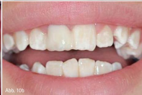
Abb. 8: Der auf einer Basis aus Glasfaserstrang und Flow-Composite (GrandioSO Heavy Flow, VOCO) modellierte Zahnaufbau aus höchstästhetischem Composite (Amaris, VOCO) schließt die Lücke zwischen Zahn 12 und 21. – Abb. 9: Die vestibuläre Ansicht zeigt die stimmige Proportionalität zu Zahn 21 und die natürlich anmutende Gestaltung der Inzisalkante. – Abb. 10a und b: Die fertige Restauration zeigt gerade auch aufgrund der modellierten Mamelonstrukturen und White Spots ein natürlich wirkendes und vom ursprünglichen Zahn nicht zu unterscheidendes Ergebnis.

rurgische und prothetische Versorgung mit einem Implantat gegeben sind. Nach der Wurzelfüllung galt es, minimalinvasiv eine temporäre Lückenversorgung mit einem Zahnaufbau aus Composite vorzunehmen. Hierzu wurde zunächst einmal eine stabile Basis mit GrandTEC geschaffen. Dazu waren nur wenige Vorbereitungen erforderlich. Ein in den Gipsabdruck eingebrachter Wachsdraht half bei der Längenbestimmung und Gestaltung einer aus Bissregistrierungssilikon (Registrado Clear, VOCO) gefertigten Schablone für die bogenförmige Positionierung des Glasfaserstrangs in der Lücke zwischen Zahn 12 und Zahn 21. Nach Isolierung des Arbeitsfeldes mit Kofferdam sowie Reinigung und Trocknung der Zahnoberflächen wurden die Zähne 12 und 21 palatinal mit 35%iger Phosphorsäure (Vocacid, VOCO) bei einer Einwirkzeit von 20 Sekunden angeätzt. Anschließend wurde gründlich mit Wasser abgespült und abgesaugt sowie kurz verblasen. Es folgte das Auftragen und Einmassieren eines lichthärtenden Einkomponenten-Adhäsivs (Futurabond M, VOCO) auf die konditionierten Zahnoberflächen. Nach kurzem Verblasen wurde das Adhäsiv für 20 Sekunden lichtgehärtet. Auf die mit Adhäsiv versehenen Stellen kam daraufhin eine dünne Schicht eines fließfähigen Composite (GrandioSO Heavy Flow, VOCO) in der Farbe A2 zwecks Verankerung des Glasfaserstrangs. Dieser wurde mit einer feinen