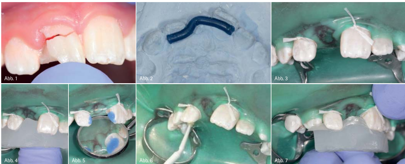
Abb. 1: Fraktur an Zahn 11 im zervikalen Bereich mit mesial-distalem Verlauf. – Abb. 2: Ein in den Oberkieferabdruck eingebrachter Wachsdraht dient der Fertigung einer Schablone aus Bissregistrierungssilikon zwecks Positionierung des Glasfaserstrangs zwischen Zahn 12 und Zahn 21. – Abb. 3: Das Arbeitsfeld nach dem Entfernen des Bruchfragments und erfolgter endodontischer Behandlung. – Abb. 4: Anpassen der aus Bissregistrierungssilikon gefertigten Schablone. – Abb. 5: Die Zähne 12 und 21 werden palatinal mit 35%iger Phosphorsäure angeätzt. – Abb. 6: Nach der Konditionierung der Zahnoberflächen wird Adhäsiv (Futurabond M, VOCO) einmassiert und lichtgehärtet. – Abb. 7: Der auf der Silikon-schablone aufliegende Glasfaserstrang (GrandTEC, VOCO) wird zwischen Zahn 12 und Zahn 21 positioniert und auf die mit Flow-Composite bestrichenen palatinalen Flächen gesetzt.

Bei Restaurationen im sensiblen Frontzahnbereich gibt es neben direkten und indirekten Keramikversorgungen längst auch minimalinvasive Möglichkeiten zur Realisierung direkter und dauerhaft beständiger Versorgungsungen mit Composite. Eine besondere Herausforderung stellt hier jedoch nach wie vor die Versorgung von Zahntraumata und -lücken dar. In solchen Fällen bedarf es einer stabilen und zuverlässigen Basis für den künstlichen Zahn.